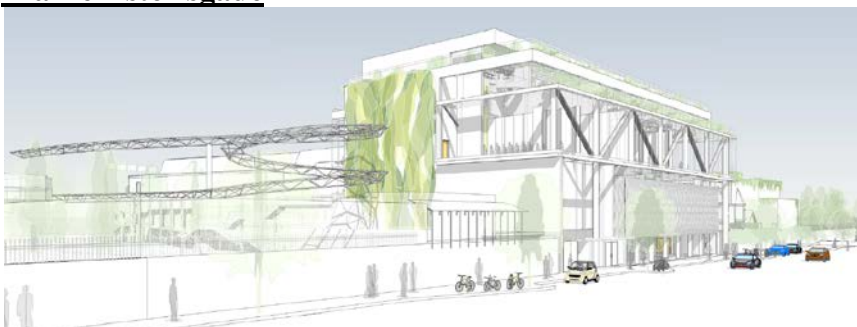
Projektet fremlagt 16. marts 2015.