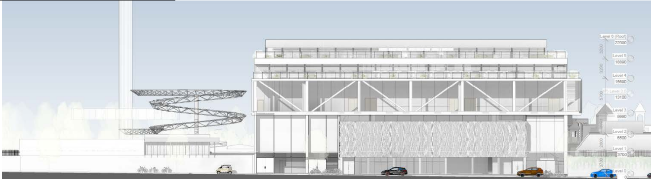
Projektet fremlagt 16. marts 2015.