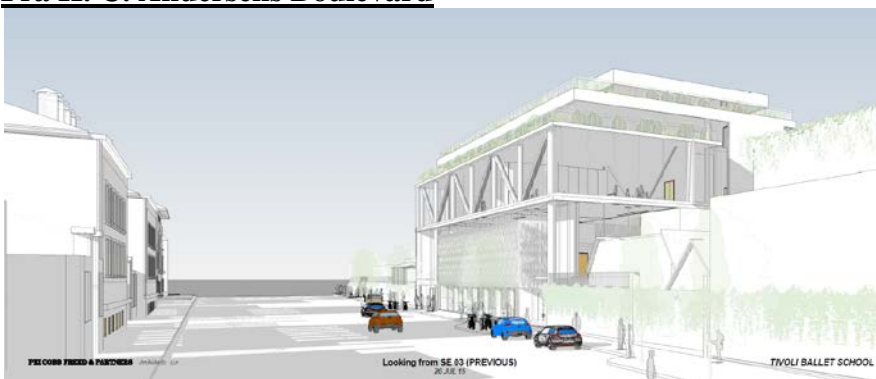
Projektet fremlagt 16. marts 2015.