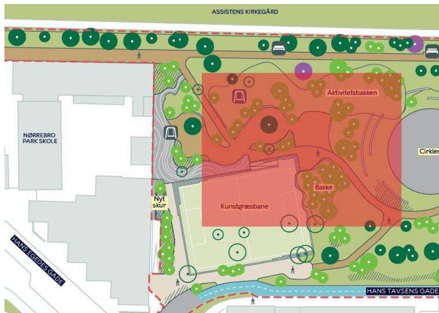
Eksempel på placering af 8v8 bane (ekskl. sikkerhedsafstand) i forhold til det nuværende projektforslag.