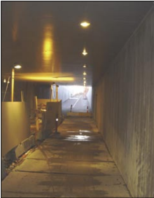
Stitunnelen under anlæg december 2005.