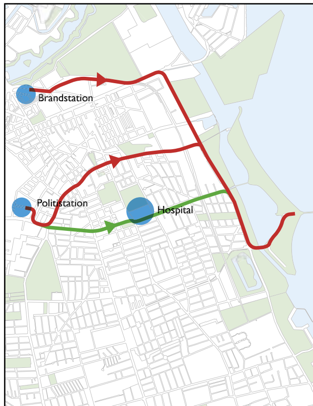
Køreveje for politi og brandvæsen til området - med og uden Italiensvej.