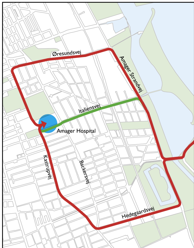
Køreveje fra Amager Strandpark til Amager Hospital med og uden Italiensvej.