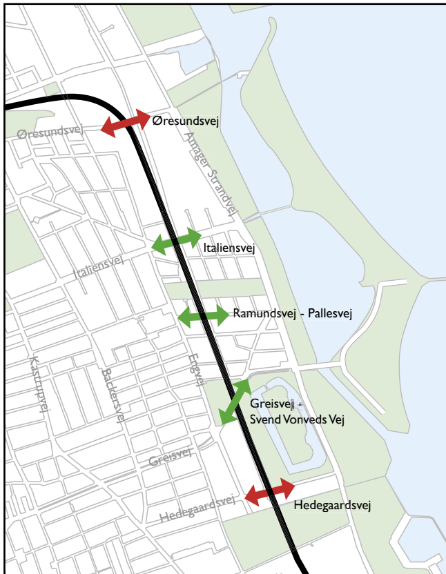
Cykel- og fodgængerforbindelser på tværs af metroanlægget.