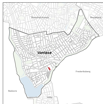
Områdets placering i bydelen.

Lokalplantillægget er i overensstemmelse med Kommuneplan 2019. I kommuneplanen er området omfattet af rammen C1 (boliger og serviceerhverv).