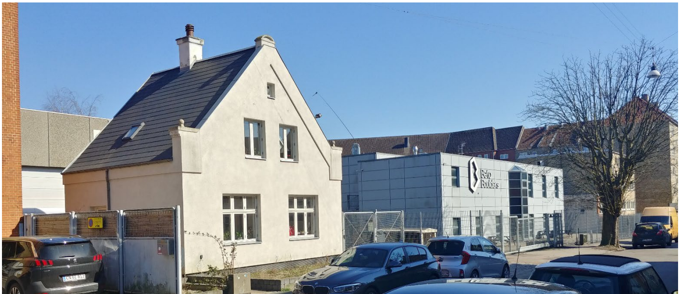
Billede af Kastanie Allé 14 i forgrunden og Kastanie Allé 8 i baggrunden. Set fra Kastanie Allé mod Linde Allé. I baggrunden anes karréerne, som er karakteristiske for området.