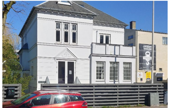
Billede af Kastanie Allé 22.