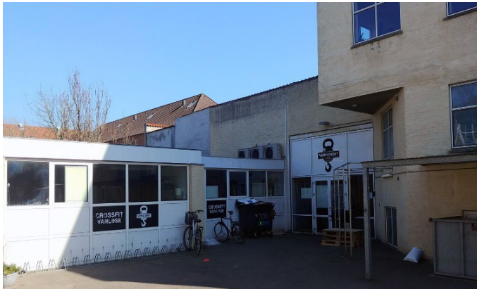
Billede af indgang til crossfitcenter på Kastanie Allé 20. Set fra parkeringsplads mod Kastanie Allé.