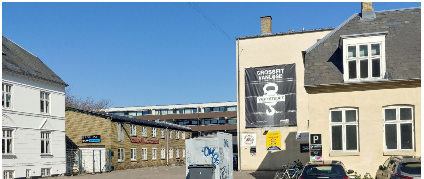
Billede af Kastanie Allé 18, 20, 22 og 22A. Set fra Kastanie Allé.