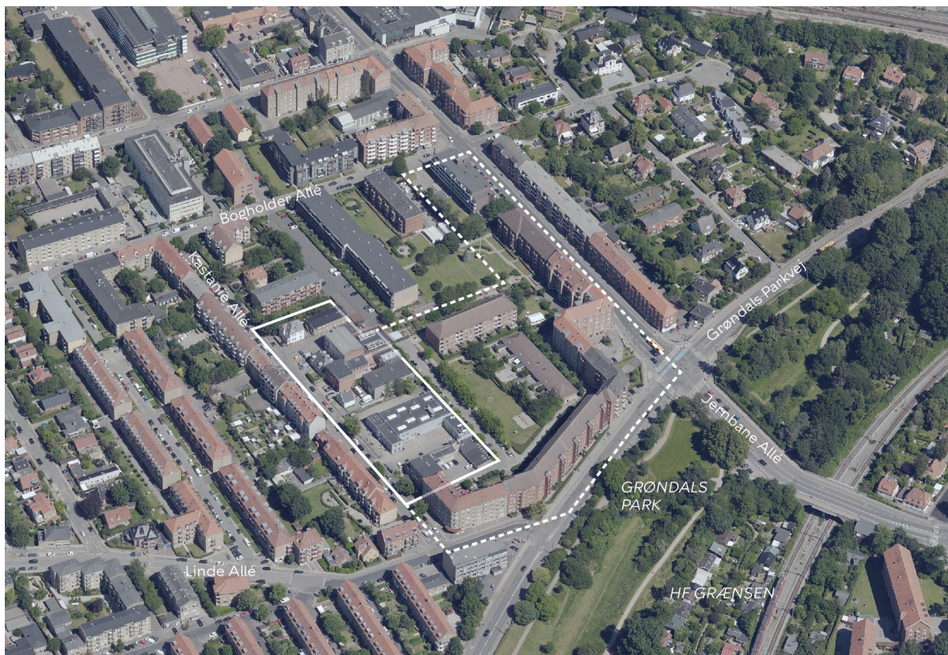
Området set mod nord. Lokalplanområdet er indtegnet med hvid linje, og grænsen for lokalplan 37 er indtegnet med stiplede linje. De vigtigste gader, parker og bygninger er navngivet.