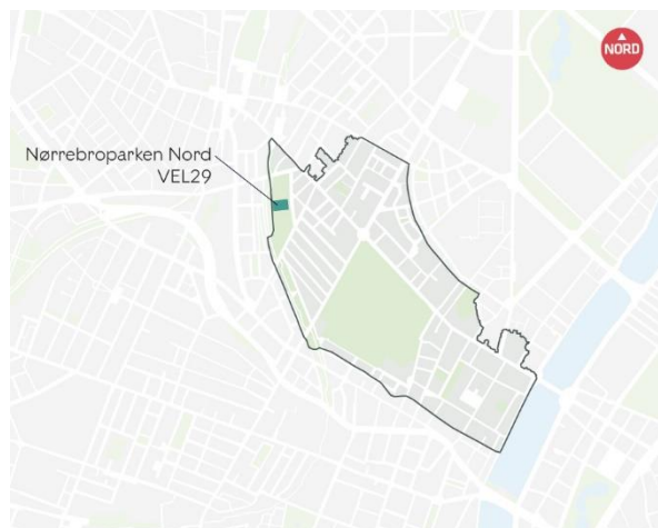
Afgrænsning af Korsgade Masterplan, og placering af projektet i Projektpakke 2021, som indgår i Korsgade Masterplan