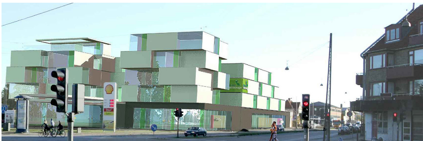
Roskildevej som den ser ud i lokalplanforslaget inden projektet blev revideret.