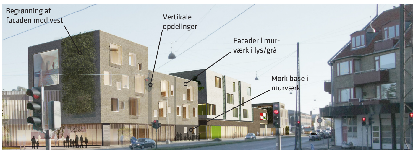
Roskildevej som den ser ud med det reviderede projekt der efter vedtagelsen indarbejdes i den endelige lokalplan .

Alle illustrationer er udarbejdet af Skovhusarkitekter.