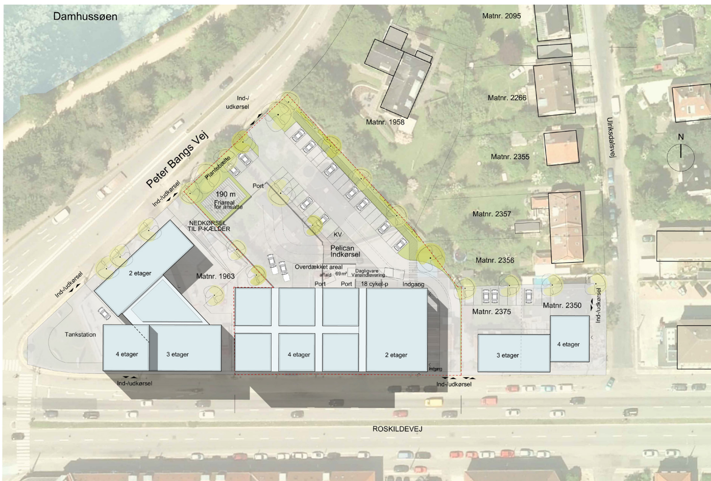
Situationsplan for den reviderede plan. Højderne samt friarealer mod Peter Bangs Vej er justeret.