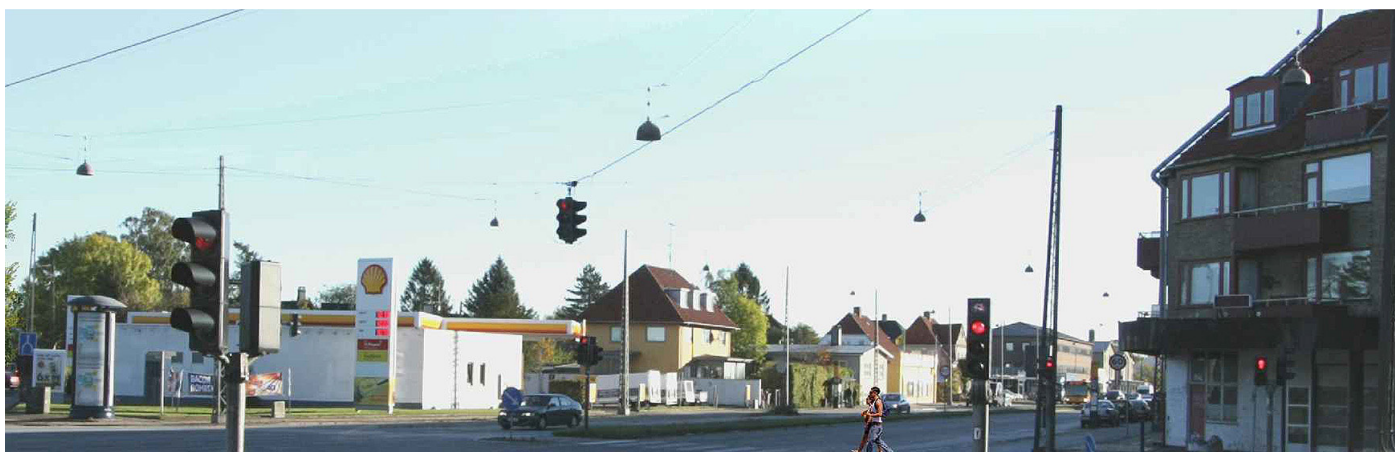
Roskildevej som den ser ud i dag.