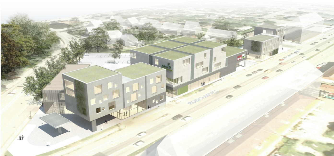
Illustration af hvordan det muliggjorte byggeri kan komme til at se ud, set mod hjørnet af Peter Bangs Vej og Roskildevej.

Alle illustrationer er udarbejdet af Skovhusarkitekter.