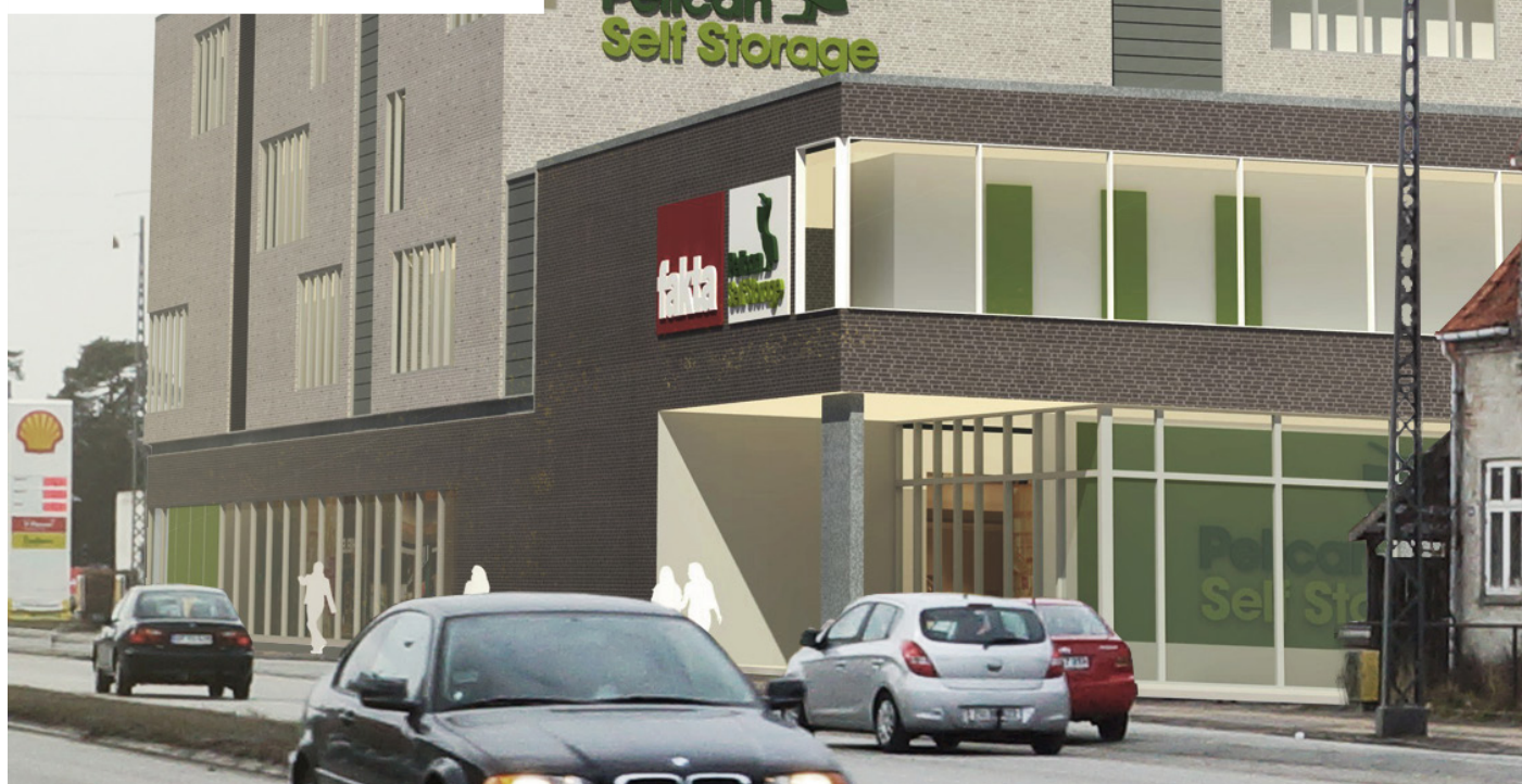
Udsnit af det foreslåede projekt.