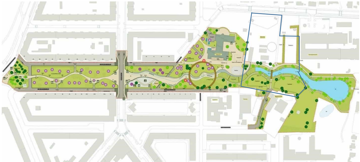
Kort 1. Plantegning over skybrudsplanen ved Karens Minde akse

en sø på området samt at der jævnført skybrudsplanen er planlagt offentlige stier rund om hestefoldene så at de har fået et meget begrænset omfang.