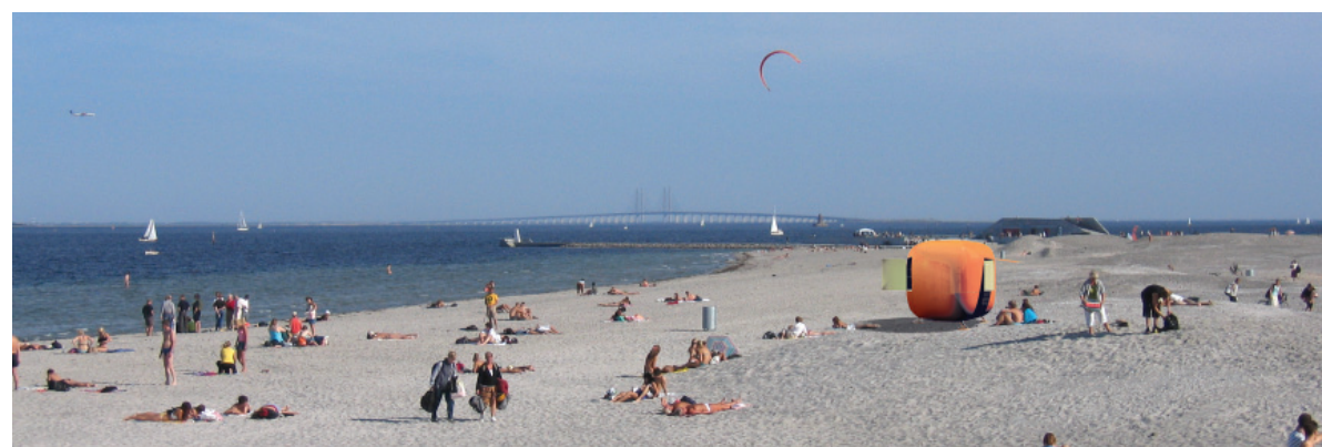
Foody som livredderstation.