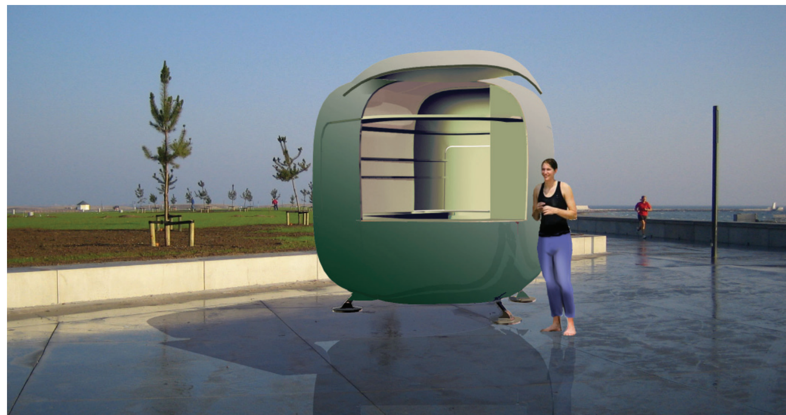
Foody som café - dog ikke i en korrekte farvekombination.