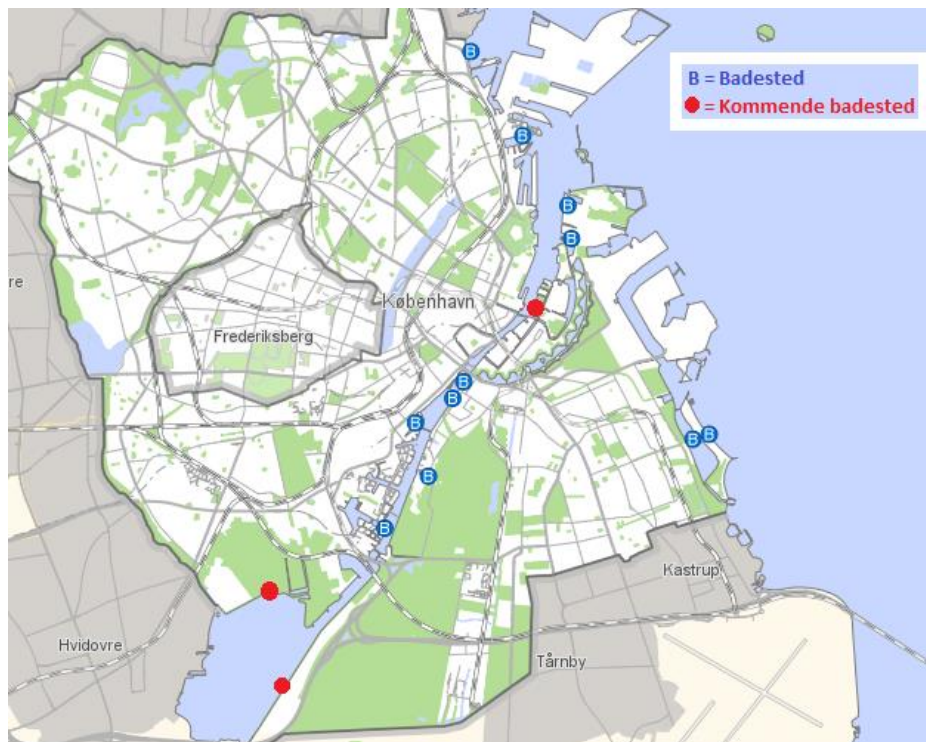
Fig. 2 Oversigt over eksisterende badesteder (2018), samt badesteder, som er ved at blive etableret.

På følgende kort (fig. 2) vises de eksisterende badesteder (2018) i hele havnen, samt de badesteder, som er ved at blive etableret.