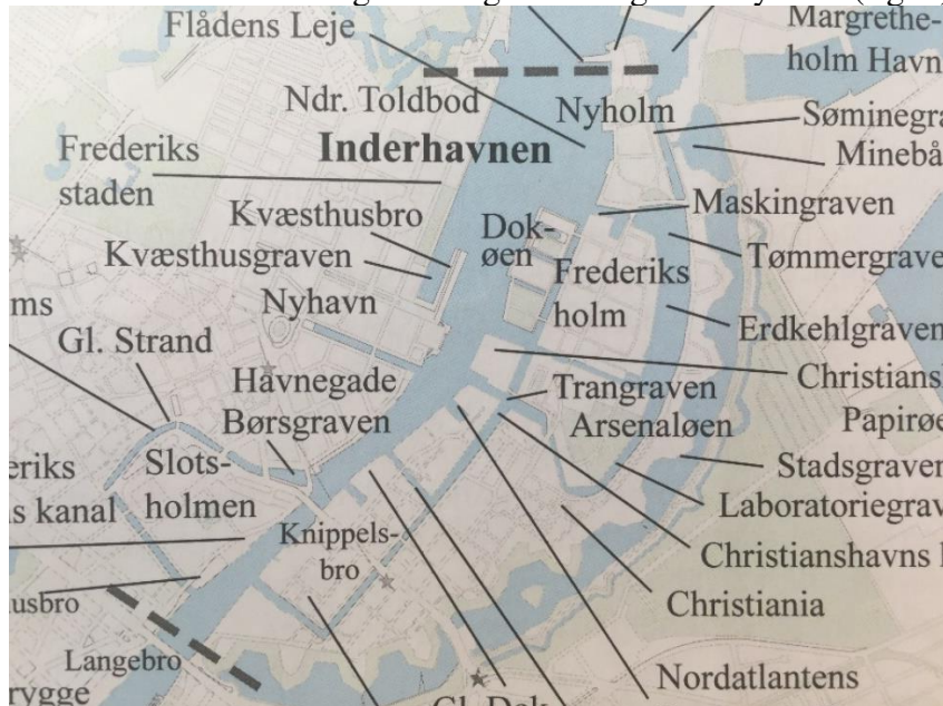
Fig. 1 Oversigt over Inderhavnen afgrænsning

Inderhavnen strækker sig fra Langebro til og med Nyholm (fig. 1):