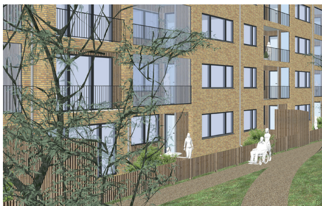
Nye facader med skalmur i tegl samt nye forhaver og nye altaner

Kommunens gennemsnitlige vægtede husleje er på 947 kr. pr. m 2