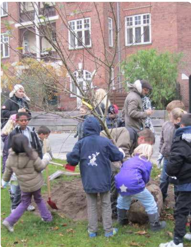
Skolebørn planter 'deres træ' i samarbejde med en gartner fra Teknik- og Miljøforvaltningen.