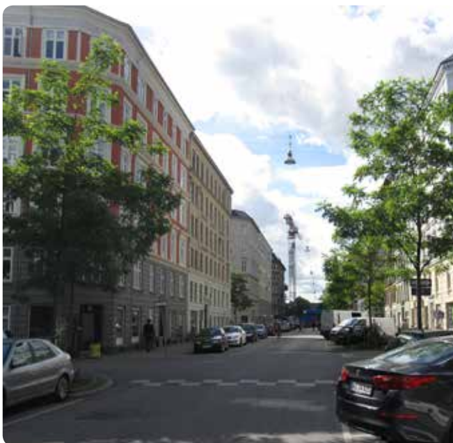
Ovenfor ses to billeder af den samme gade – uden gadetræer og med gadetræer.