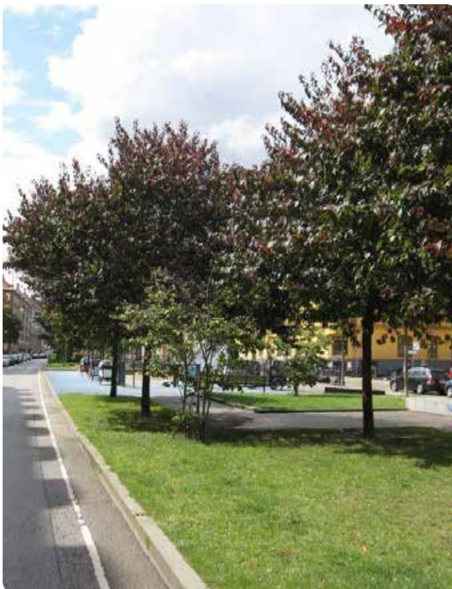
I forbindelse med renoveringen af Sønder Boulevard blev der plads til/bevaret træer, som er med til at skabe læ og skygge. Træerne er med til at skabe et trygt rum til ophold væk fra vejen