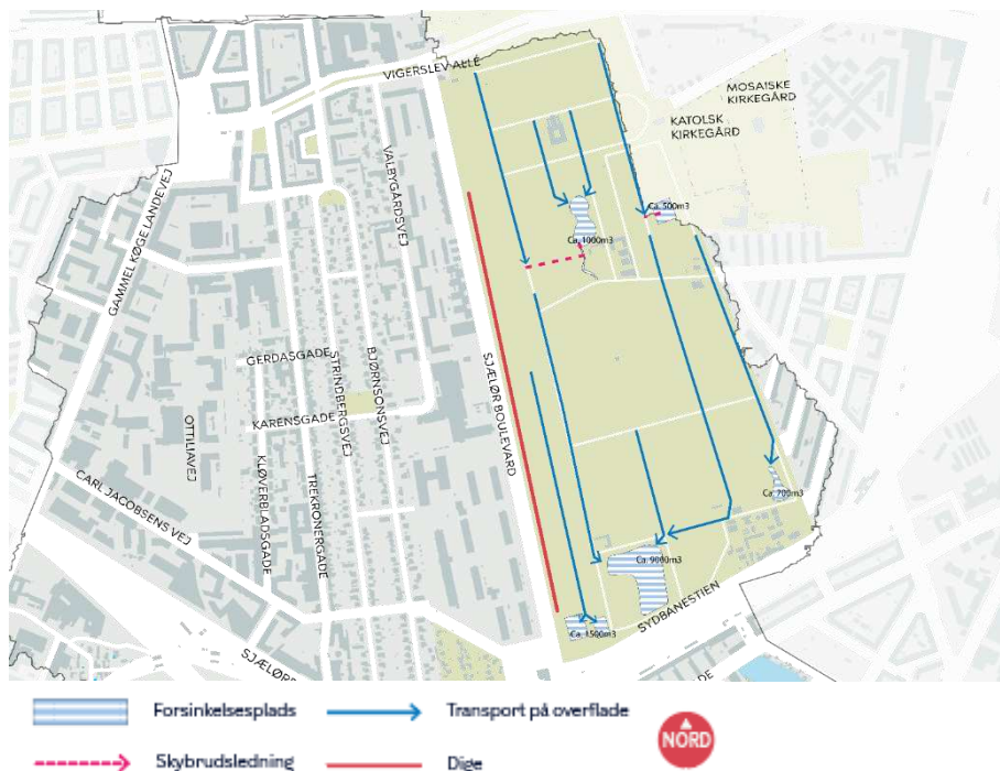
Figur 1 Tidlig skitseforslag til placering af bassiner og terrænændringer på Vestre Kirkegård

Anlægsbudgettet er 31,2 mio. kr. heraf har Borgerrepræsentationen den 13. december 2018 bevilget og frigivet en anlægsbevilling på 1,202 mio. kr. til foranalyse. Der søges derfor om yderligere 30,0 mio. kr. til projektering og udførelse af anlægsprojektet.