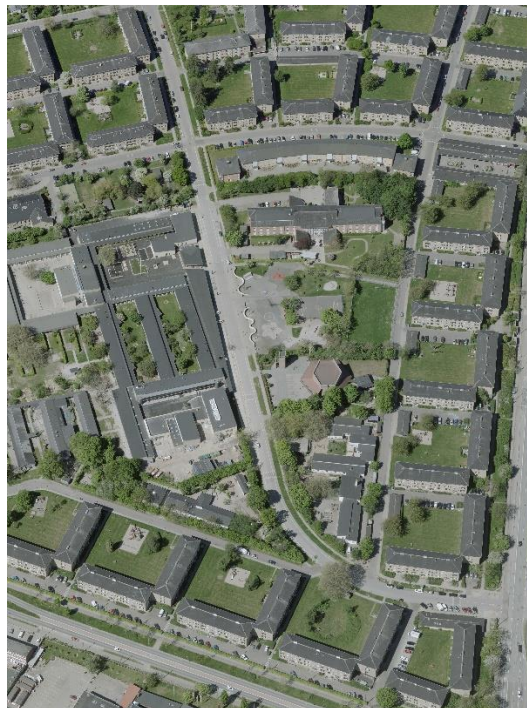
Valby: Typisk B2-område med etagebebyggelse i stokke i åben karreform

Ved lokalplaner fastsættes krav i overensstemmelse med kommuneplanen. I byggesagsbehandling, i områder uden lokalplan, sker der en helhedsvurdering ud fra bl.a. konteksten og kommunens pligt til at virke for kommuneplanen.