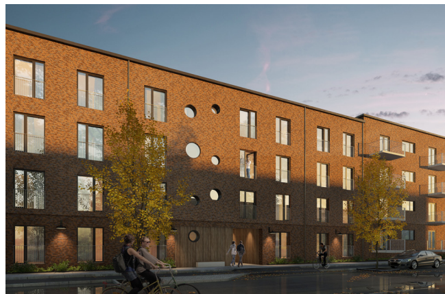
Gadebillede af det reviderede ungdomsboligprojekt på Rovsinggade 63 (Illustration Rambøll)