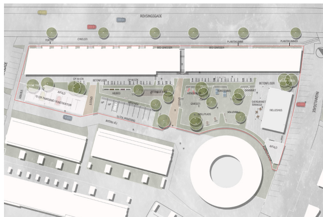
Situationsplan af det reviderede ungdomsboligprojekt på Rovsinggade 63