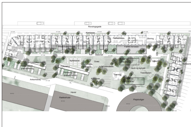
Situationplan af Skema A projektet for ungdomsboligerne på Rovsinggade 63