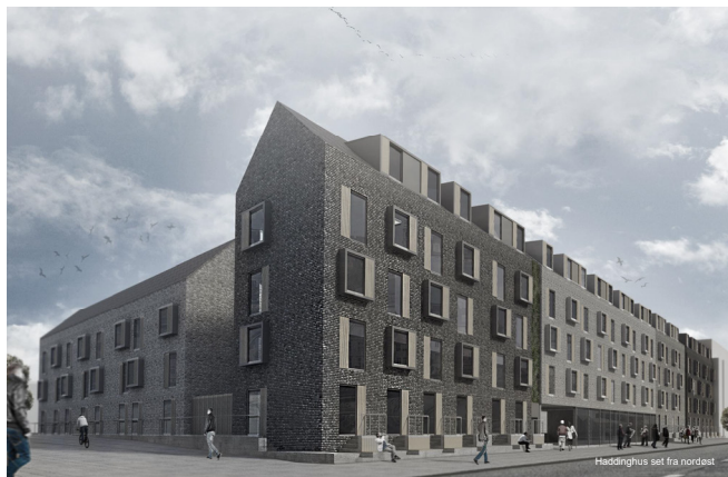
Gadebillede af det politisk godkendte Skema A projekt af ungdomsboligerne på Rovsinggade 63 (Illustration KHS arkitekter)