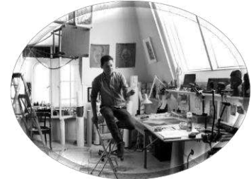
125 år gamle atelierer, 2018