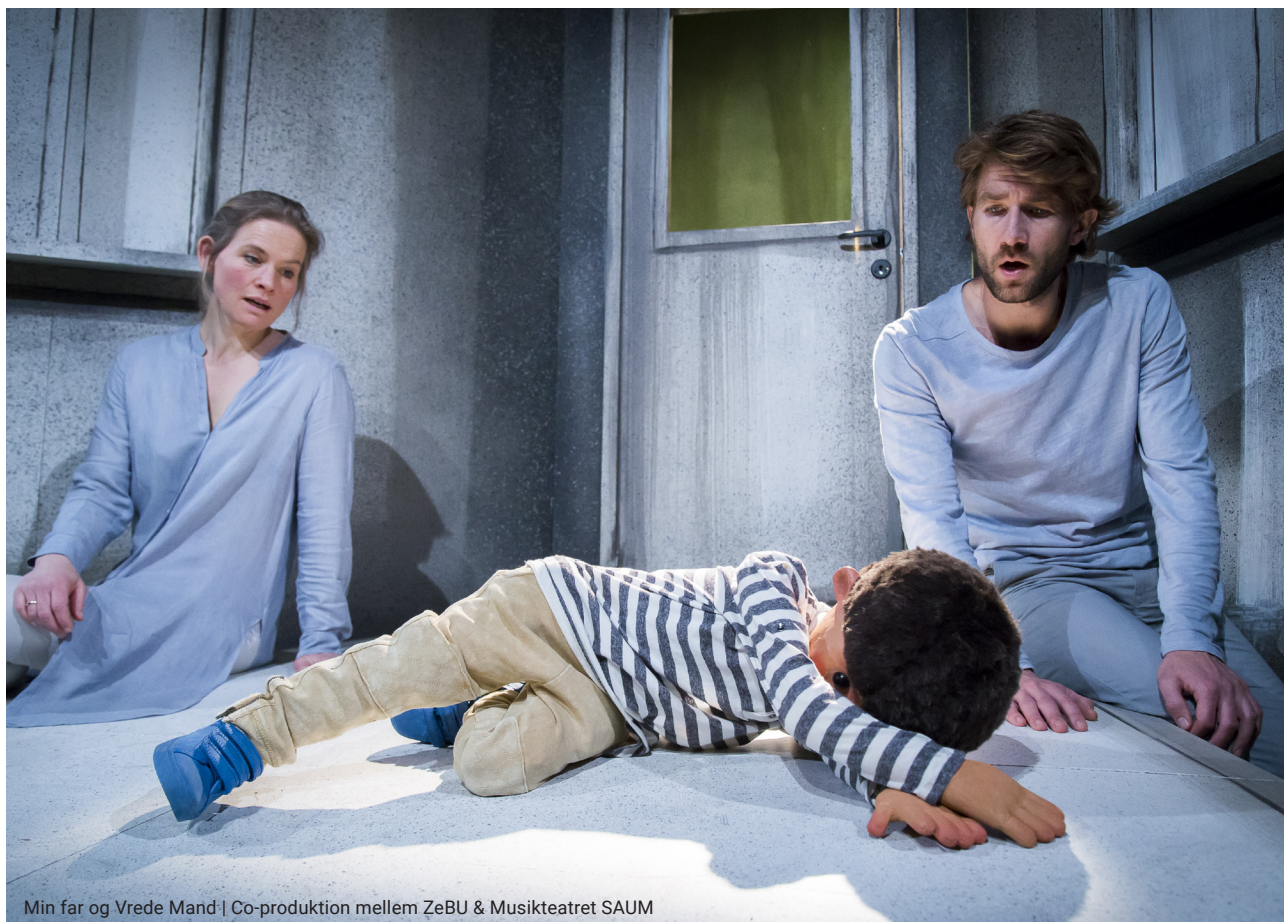
Min far og Vrede Mand | Co-produktion mellem ZeBU & Musikteatret SAUM

Ser man på variationer i genre, stilart og indhold understreger vores repertoire, hvilken fantastisk spændvidde der eksisterer i moderne scenekunst for børn og unge. Der er gendigtninger af nordiske sagaer og europæiske folkeeventyr, der er nyskrevet dansk dramatik, ordløst krops- og danseteater, ny cirkus og poetisk klovneteater, dukketeater, opera, debat- og interaktivt teater. Der fortælles gribende historier om emigranter og indvandrere, hjemvendte soldater og familier