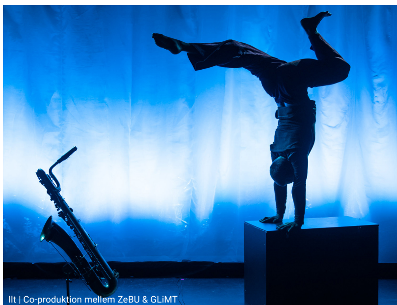
lft | Co-produktion mellem ZeBU & GLiMT