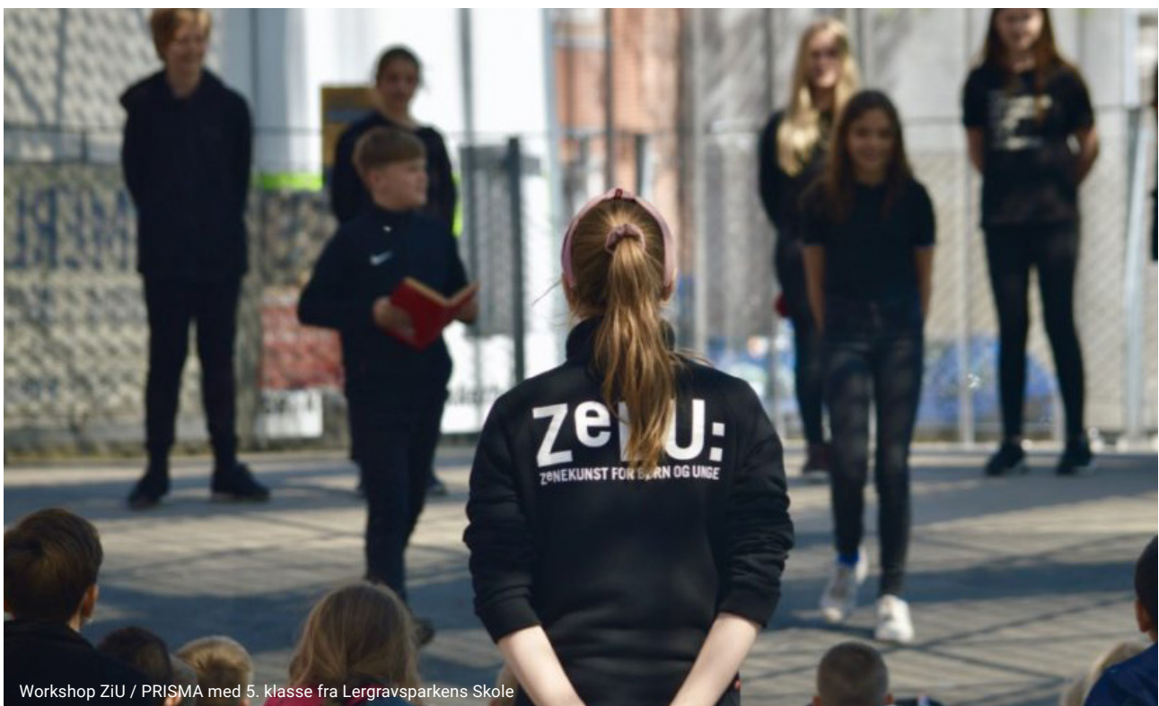
Workshop ZiU / PRISMA med 5. klasse fra Lergravsparkens Skole

Derudover giver vi hver sæson plads til, at eksterne scenekunstprojekter kan leje sig ind på ZeBUs scene. F.eks. Vildskudfestival, forestillinger under CPH STAGE, højskoler der spiller elevforestillinger, lokale teaterskoler og andre fra teatrets vækstlag.