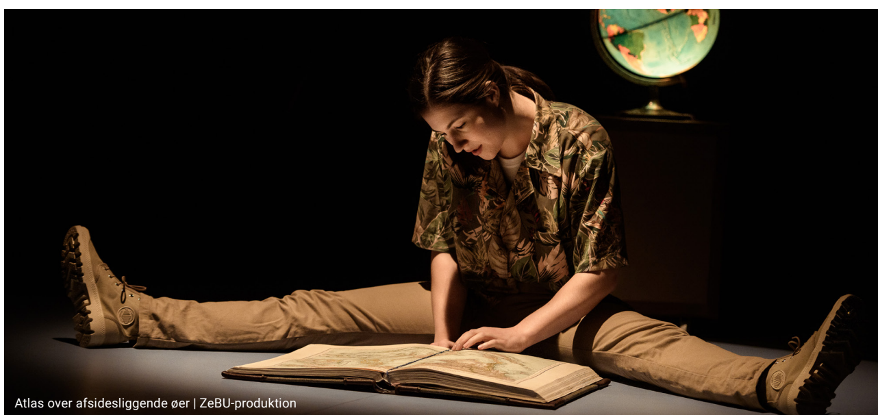
Atlas over afsidesliggende øer | ZeBU-produktion

Men selvfølgelig er den gode og vedkommen-