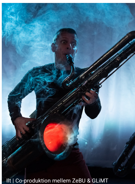
lft | Co-produktion mellem ZeBU & GLiMT

Vi samler fra januar 2021 alle kræfter omkring vores stationære aktiviteter på Amager, bl.a. ved at udfase ZeBUS turnéaktivitet og ved at nedlægge vores produktionsfaciliteter i Smedehallen i Vanløse. Vi forventer at kunne løse langt det meste af vores behov for produktions- og prøvefaciliteter, samt behov for plads til opbevaring ved en optimal udnyttelse af teatersalen, alle 12 måneder om året. Desuden bibeholder vi et eksternt lager, som vi allerede