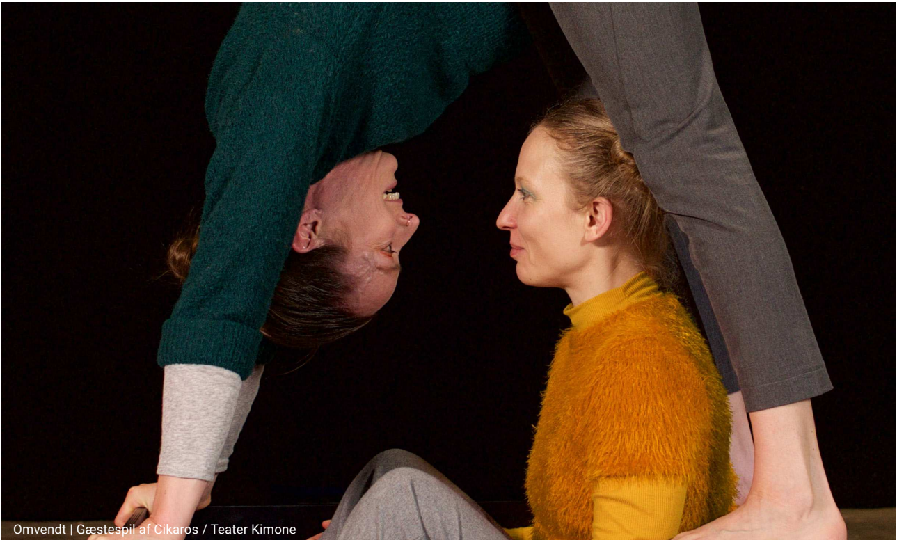
Omvendt | Gæstespil af Cikaros / Teater Kimone

publikummet. Som udgangspunkt præsenteres aktiviteterne i teatrets lokaler på Øresundsvej 4 på Amager, men også andre spillesteder på Amager og i resten af Københavns Kommune kan komme på tale.