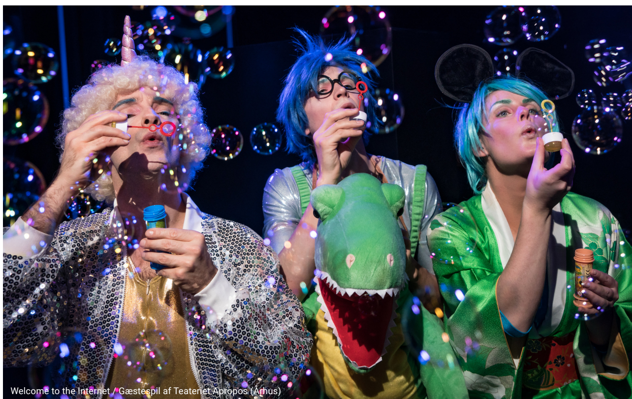
Welcome to the Internet / Gæstespil af Teateret Apropos (Århus)

Et helt nyt format bliver projektet De ukendte , hvor en skuespiller spiller og fortæller historier om spændende, men ukendte, lokale eksistenser. Først opført i hovedpersonens eget miljø, og senere samlet til én egentlig forestilling på ZeBU, hvor hovedpersonerne også selv er med på scenen.