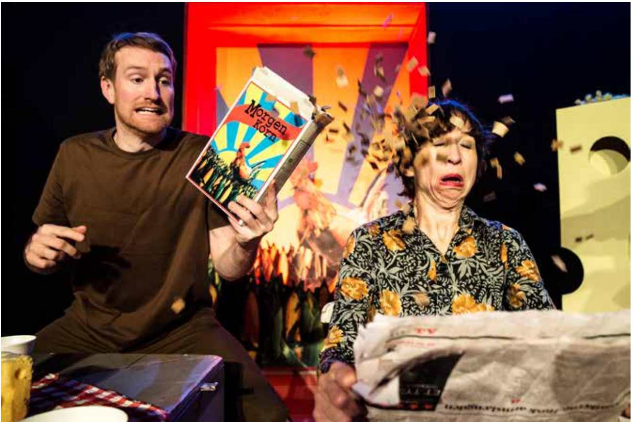
Far, Mor & Børn - HVER DAG!

Derfor er placeringen på Østerbro idéel – med Krudttønden som scene, når der spilles stationære forestillinger, og bybilledet, parkerne, vores workshopsal, skoler og institutioner som hjemsted for de øvrige aktiviteter.