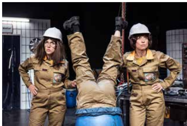
Jul – det er TANKEN der tæller.

Vi ønsker at være med til at puste liv i Krudttønden og skabe et hus, der er kreativt, nyskabende, samfundsrelevant og med kunstnerisk indhold af