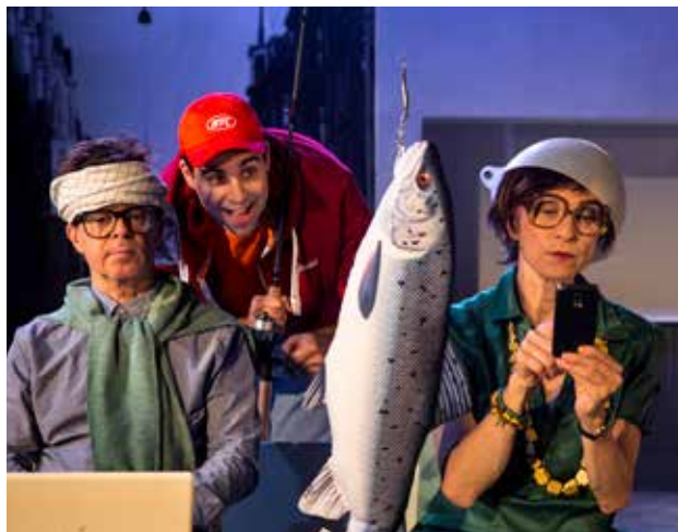
Den Store Jagt På Lykken.

udvikling af dramaskole, med Dramatiker Væksthus om udvikling af dramatik baseret på børns egne historier, med Monkey KBH – Performing Arts 4 Kids om lokaler og kunstnerisk udveksling. Vi deltager i kaffe-, netværks- og branchemøder, hvor der spares og diskuteres og udvikles. Hos vores hidtidige "værter" BIBLIOTEKET og Teater FÅR302 har vi haft samarbejde i forhold til kontor- og scenefaciliteter, markedsføring, billetsalg, rengørings- og forhuspersonale, og vi er netop nu i gang med at udvikle et sådant samarbejde med Krudttønden, der kan være til glæde for begge parter.