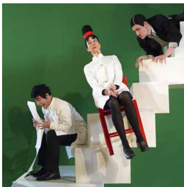
"Sig vov til din angst".

I forankringsprocessen på Østerbro har vi godt fat i publikum, men vi håber også at kunne tiltrække publikum fra andre bydele, da infrastrukturen fungerer godt til og fra Krudttønden.