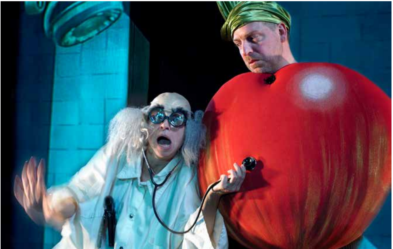
ÆBLET OG ORMEN.

og internationalt. De tilknyttede kunstnere på teatret deltager derudover så meget som muligt i kunstnerisk udviklende kurser, workshops, internationale arrangementer og lign.