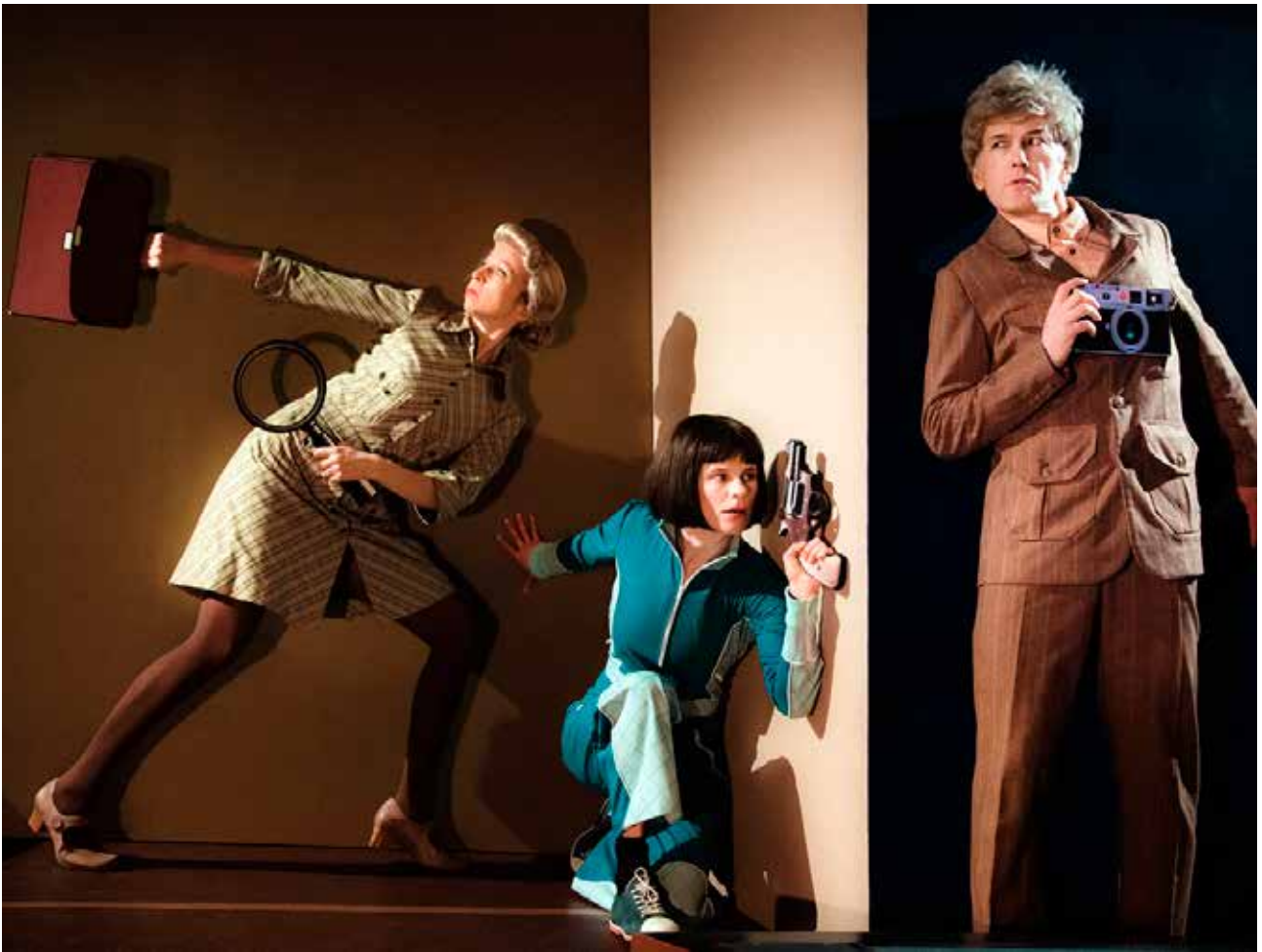
HUND 009.