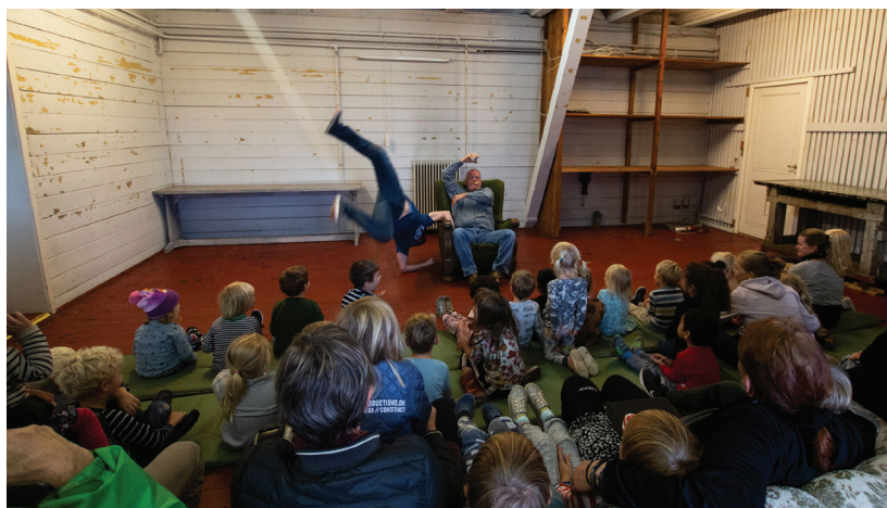
Forestillingen Medusa i salen Nordpolen på Magneten.