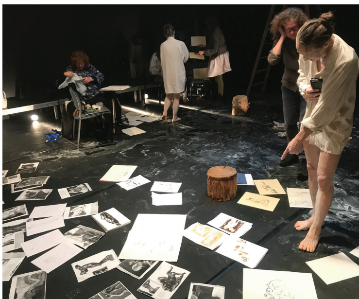
Croquis-tegning med danserne efter forestillingen RODIN - En Dans i Sten

Vi vil gerne booste den potentielle viden og læring, der kan opstå på tværs af produktioner på vores åbne platform ved eksempelvis at arbejde strategisk med visuelle videndelingsmetoder og ved at invitere til tværgående møder for fagfolk og publikum. Dét arbejde kan også skærpe vores viden om, hvordan vi kan sammensætte publikum på nye, spændende og uforudsigelige måder i forhold til at skabe en kvalitativt bedre, magisk og kreativ oplevelse. Igen er formålet at skabe de rum, hvor publikum kan møde kunstnerne, hinanden og stedet på måder, der gør, at deltagerne også selv kan få oplevelsen af at være kreative og medskabende aktører. Vi vil gerne være med til at styrke det kreative medborgerskab og den kulturelle empowerment. Aktionsuniversitetet på Teaterøen giver mulighed for at vi skærper vores viden om kvaliteten af deltagelse og at vi kan sprede denne viden til offentlige organisationer i hele landet.