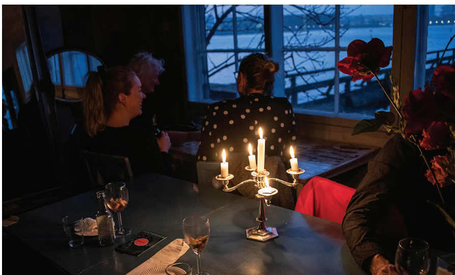
Teater Tapas på Magneten