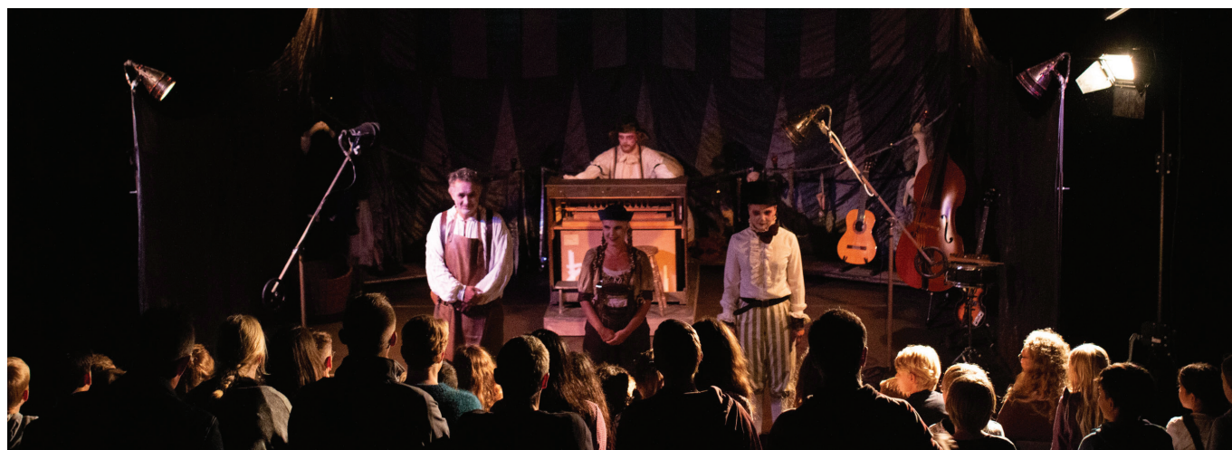
'Pinnocchio' af Teater Patrasket i Teatersalen på Kasernen

Teaterøens publikum er både det nysgerrige publikum, der er åbne for eksperimenterende oplevelser, og teatergængere, der tiltrækkes af en særlig forestilling, skuespiller, tematik eller kompagnie. Som åben platform for scenekunst er repertoireet mangfoldigt og det afspejles i publikum. Samtidig er der en stor skare, der tiltrækkes af Teaterøens unikke bygninger, historie og stedets ånd.