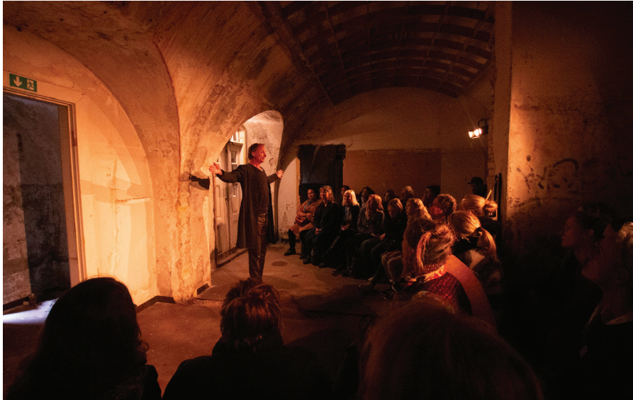
'Holger' af Det Fortællende Teater i Bunkeren

Offentlige tilskud er afgørende for, at vi kan tilbyde prøvefaciliteter til en prøvesalshungrende scenekunstbranche, og vi har mere end 150 prøveforløb, forpremierer, procesvisninger mm. over sæsonen.