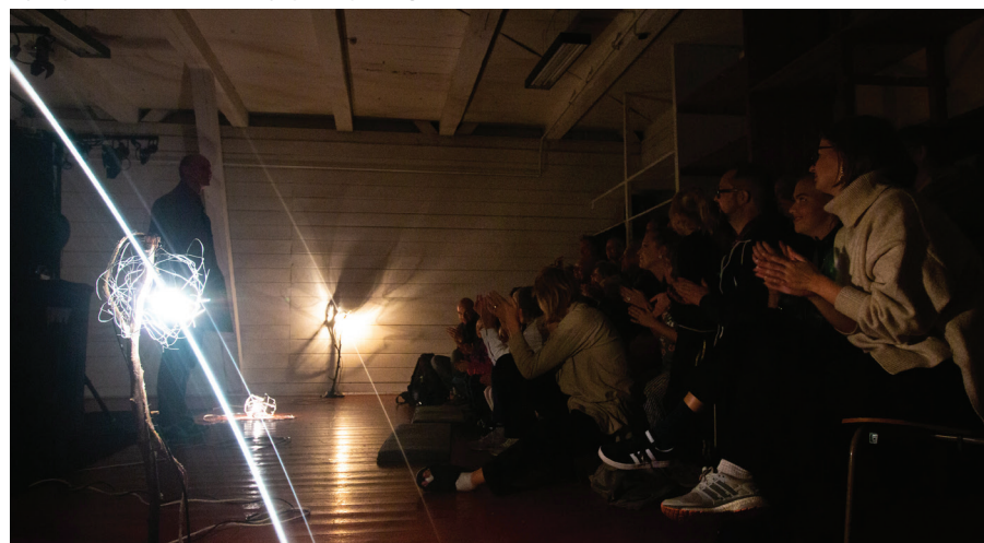
'Fyrtøjet' af Teatret Værk i Sydpolen på Magneten.

Sådanne steder opdyrkes og fremmes ikke uden bevidste strategier og metoder. Det kræver massiv investering, hvis sådanne steder for alvor skal kunne blive storbyens livskilde til en mærkbar oplevelse af skabelseskraft, sunde fællesskaber og relationer. Sådanne steder ser vi netop nu vokse op i andre Europæiske storbyer fx The Knowledge Mile i Amsterdam. Nogen ville kalde Teaterøen et kulturelt campus, nogen et kunstnerisk hub, andre et visionshus – eller i den mere folkekære ende – et moderne