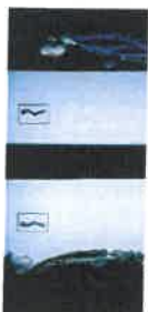
Ground-Floor Group PARALLEL