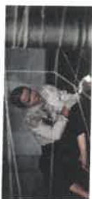
Auster & Ulmen De religiøse elektrisitet