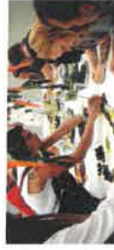
Tomoko Take Eatscape

Tomoko Take was Artist-in-Residence at Warehouse9 in August 2013. Tomoko's residency included an artist talk, performance workshop and the performance 'Eatscape', a pop up restaurant performance that rounded off the residency programme.