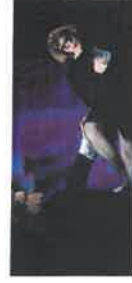
Split Britches Retro(ge)erspective