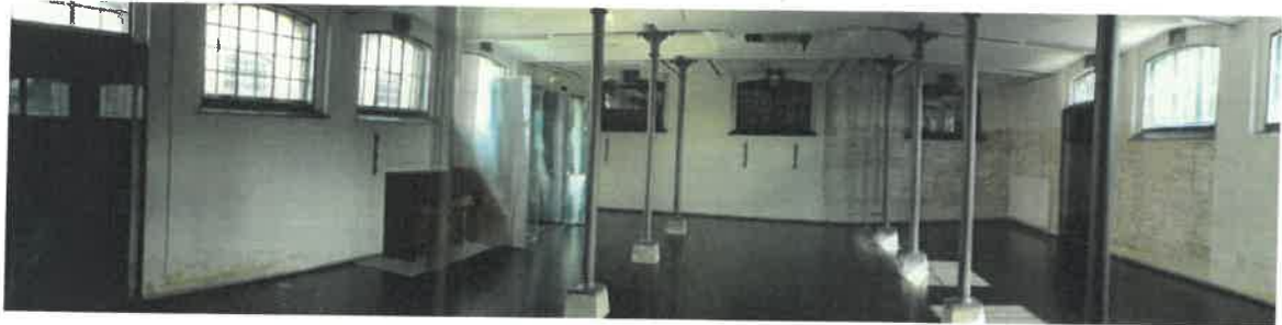
Performancescenen efter renoveringen i 2009 af arkitektfirmaet Barfod og Rasmussen.

Her tages specielt hensyn til at bygningen er fredet og har kulturhistorisk værdi og at dette kræver ekstra ressourcer mht. drift og vedligehold, samt at området er socialt belastet og udfordret af det nye stofindtagelsesrum H17. Derigennem er der etableret en dialog med Slots- og Kulturstyrelsen om den positive synergi der ligger i at bruge af fredede bygninger til kunst- og kultur, som tilgodeser både offentligheden, bygningens bevaringsmæssige værdier, samt skaber unikke forhold for kunstnerisk praksis i stedsspecifikke rum. Udviklingen og sikringen af bygningen som en platform for scenekunst i et kommunalt regi over den 13-årige periode har været en ressourcekrævende og langstrakt proces. Det er derfor nu nødvendigt at udvikle en bæredygtig driftsmodel for en projektscene med et tilhørende team, der tilgodeser alle driftsopgaver og sikrer et godt og velfungerende arbejdsmiljø, som kan facilitere det kunstneriske program og stedets udvikling i fremtiden.