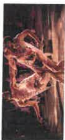
Sildenaflil Faly Eye Candy