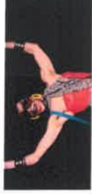
Narcissister Every Woman