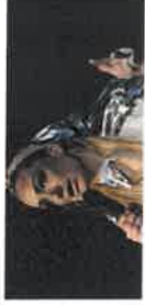
Lucy McCormick Implic Theat