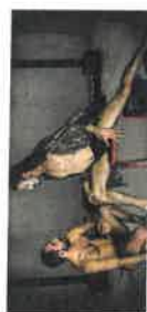
Sildenaflil Faly Tropical Escape