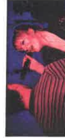
FK Alexander (I Could Go On Singing) Over The Rainbow

The programme consisted of: FK Alexander's adaptation version of '(I Could Go On Singing) Over The Rainbow', iconic lesbian-an-feminist theatre company Split Britches' performance 'Retro(ge)erspective', and Boaz Barkan's performance 'Our Other Body'.