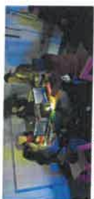
Mincraft your City

WANDERLOST - Digital Art Festival explored the cultural evolution of the European city of the future. It addressed the growing complexity of life in today's city spaces and imminent challenges to the development of the urban environment. The festival was part of the EU project 'The People's Smart Sculpture', which explored the possibilities of participation that will become a smart culture technique as a result of the ongoing digitalization of society.