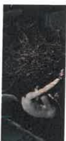
Mischa Badasyan Prestige