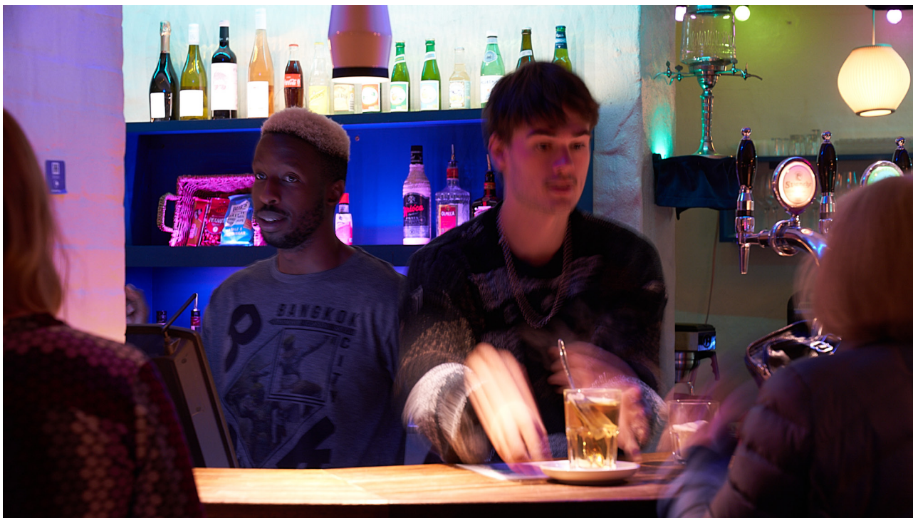
En hyggelig aften i Underhuset.

Engang imellem lægger vi hus til nogle helt anderledes målgrupper. Senest med ungdomsteatret GRAENSELOES, der sidste sæson spillede en ungdomsforestilling gennem Åben Skole-ordningen i forbindelse med ”uge sex”, og i år præsenterede en forestilling i almindeligt billetsalg med efterfølgende skoleworkshop for 6. klasser.