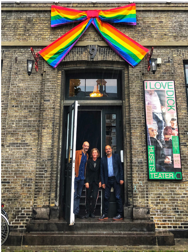
Husets Teaters pyntede facade under Copenhagen Pride.

overordnede dagsorden at sikre mere dagligt civilt liv i Kødbyen, for at øge trygheden for alle. Det er vores opfattelse, at vores tilgang opleves som konstruktiv og vi er meget glade for samarbejdet med Mændenes Hjem og med udlejer KEjd.