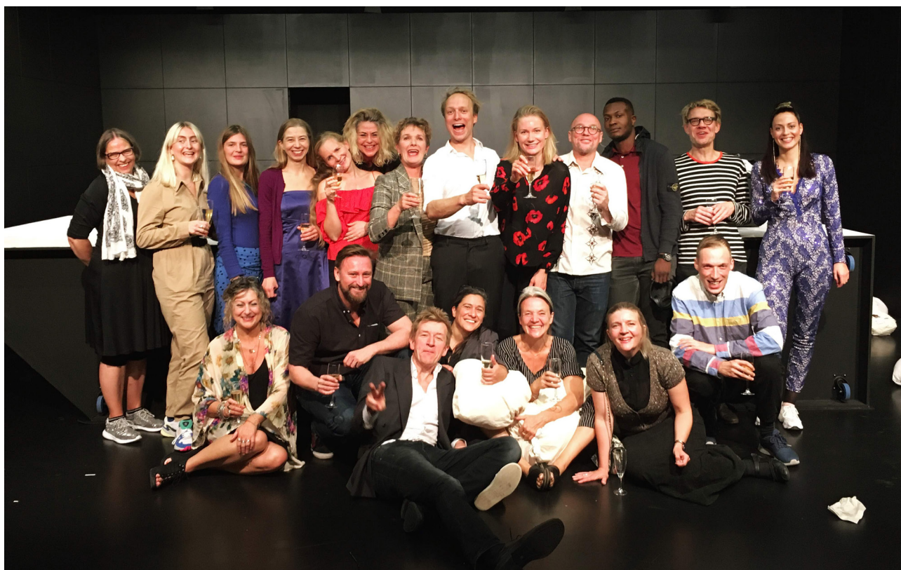
Klassfoto' efter en vellykket premiere.

Teatrets personalegruppe kendetegnes ved at være stabil og fagligt meget stærk. Udover undertegnede har teatret fire fastansatte medarbejdere på fuld tid: En dramaturg, en scenemester, en hustekniker og en kommunikationsansvarlig. Dertil kommer fire fastansatte på deltid, som alle har været på teatret i mange år: En regissør, en billetmedarbejder, en barchef og en rengøringsmedarbejder.