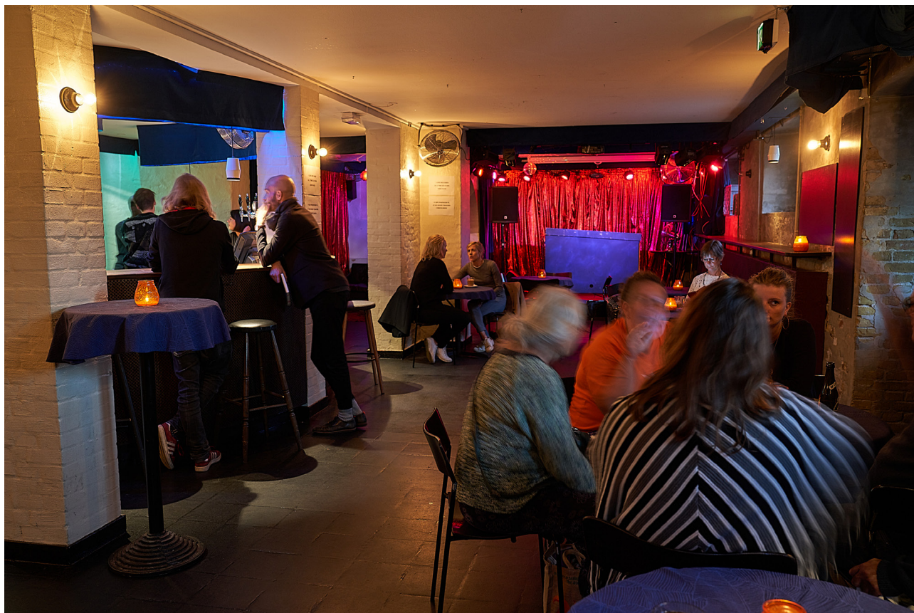
Foyerbaren Underhuset.

le i Den Grå Kødby, som vi overtager i 2020, samt kostumelagre fordelt under skråtagene i flere bygninger omkring Den Brune Kødby. At vi har valgt at takke ja til et større lager end vores behov er lige nu, skyldes at det var vores eneste chance for at bibeholde et lager Kødbyen, og at vi ikke ønsker at gøre os afhængige af biler. Til gengæld er det aftalt med udlejer KEjd, at vi må videreudleje dele af det nye lager og vi har lavet aftaler med en række mindre scenekunstaktører om, at de kan leje plads hos os på fleksible vilkår.