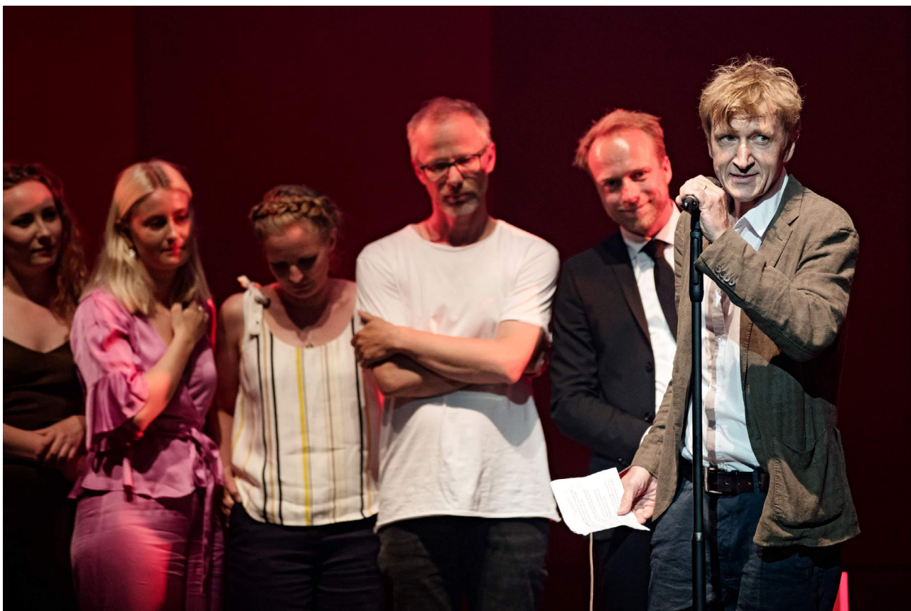
Husets Teater og holdet bag ROCKY i på scenen for at modtage Årets Særpris ved Reumertuddelingen 2018.

Det er uomgængeligt, at der i København i dag, ved siden af vores nationalscene, skal findes en intim mindre scene, hvor man kan finde den nødvendige kunstneriske tyngde til at vise os, hvem vi også er – set i lyset af vores grundfortællinger.