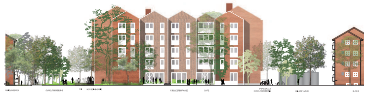
Facade mod nord.

Der etableres 14 parkeringspladser, hvoraf 3 pladser er beregnet for handicappede- og turbus. Der etableres 46 cykelparkeringspladser, hvoraf 24 er overdækkede. Hertil etableres der 5 overdækkede cykelparkeringspladser for særligt pladskrævende cykler i forbindelse med el-scooter garagen.