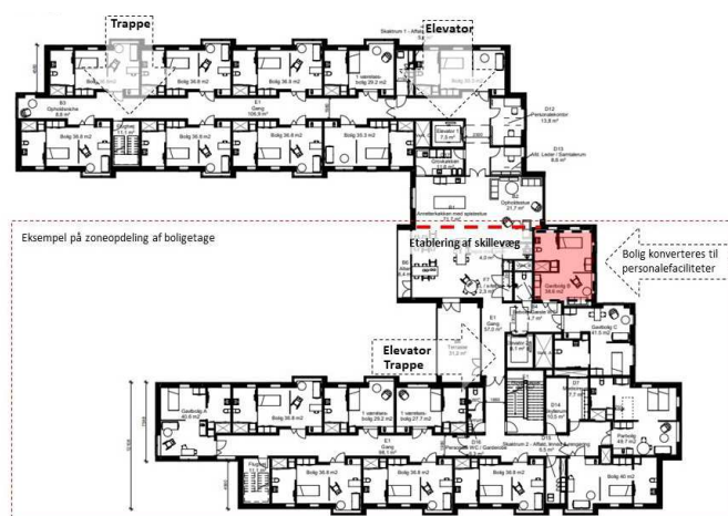
Etageplan af boligetagerne (1.- 4.sal) der viser mulighederne for at etablere pandemisikring ved behov.