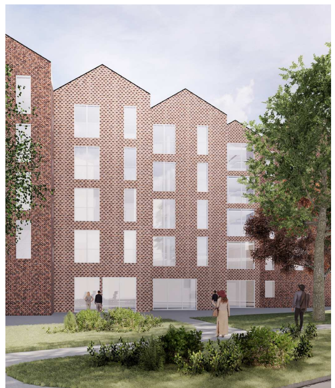
Visualisering der viser plejhjemmets facade mod nord.