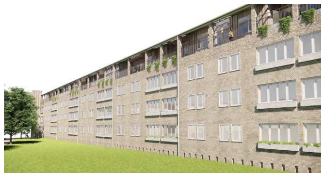
Illustration: Eksempel på udseende af tagetage ifølge lokalplanen. Illustration Vandkunsten.