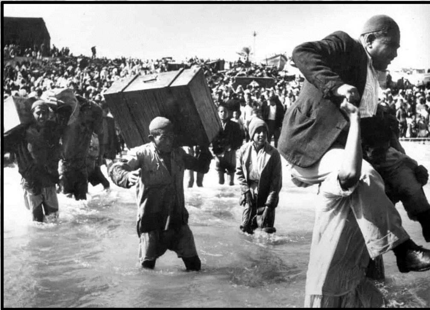
Flugten fra Palæstina i 1948

Hele artiklen kan læses her https://globalnyt.dk/75-aaret-for-nakba-katastrofen-der-aldrig-ender/