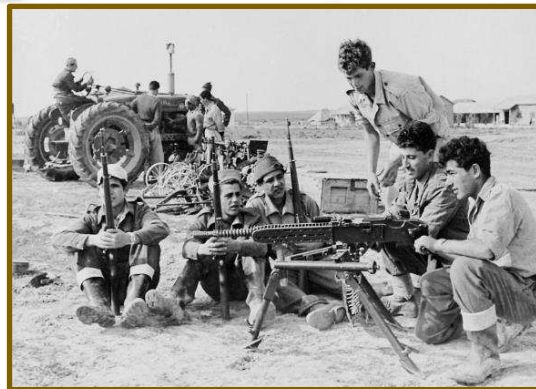
Fordrevne / flygtende palæstinensere og israelske soldater i 1948