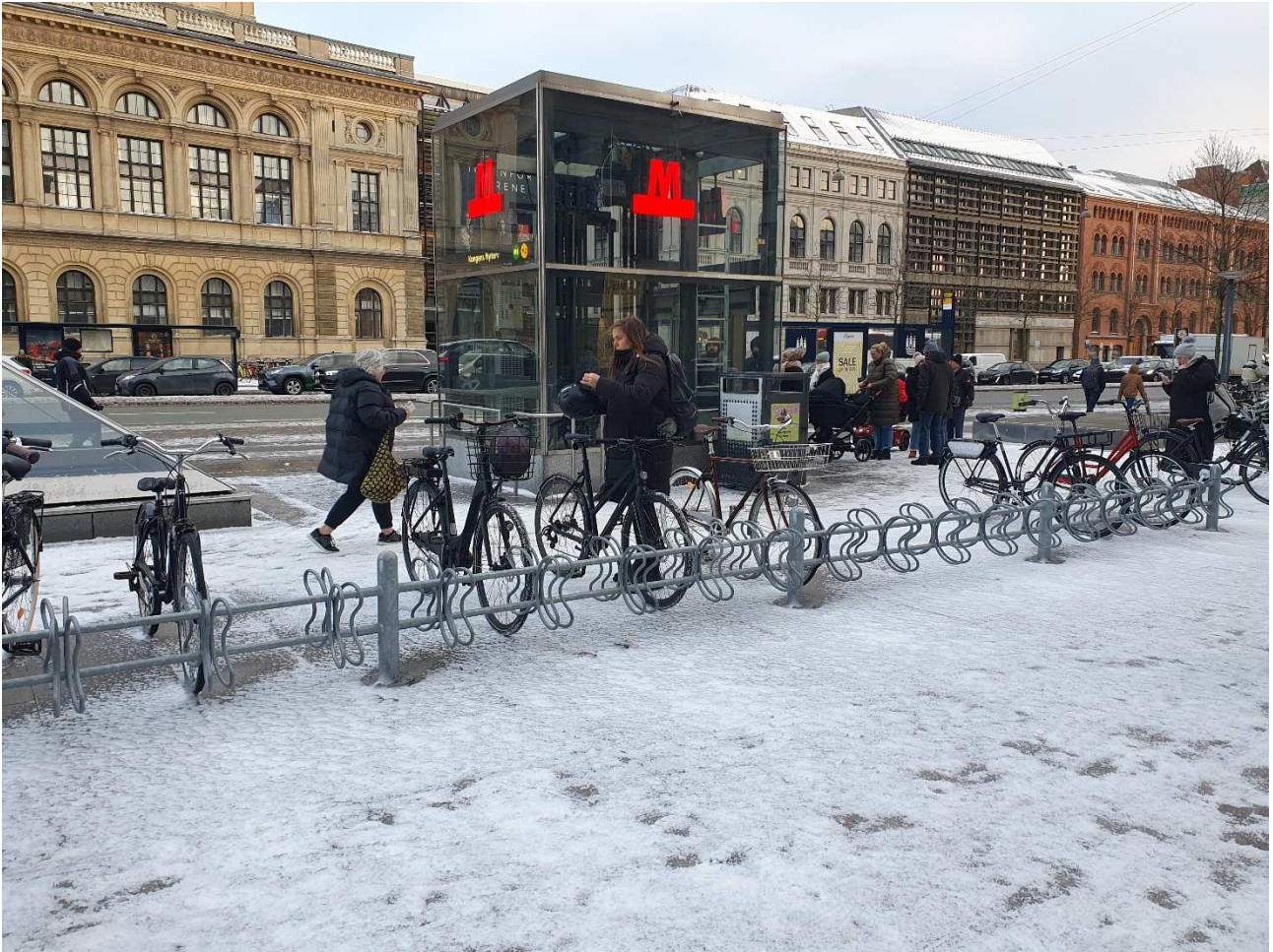
Masser af pladser på Kongens Nytorv