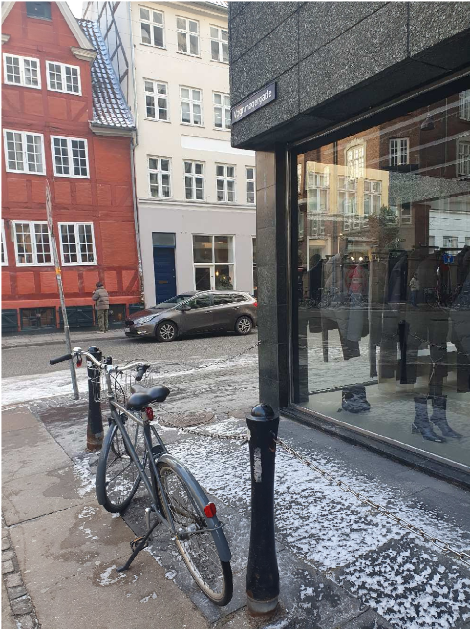
Vognmærgade: Forsøg på at holde cykler væk med det resultat, at de parkerer på selve fortovet