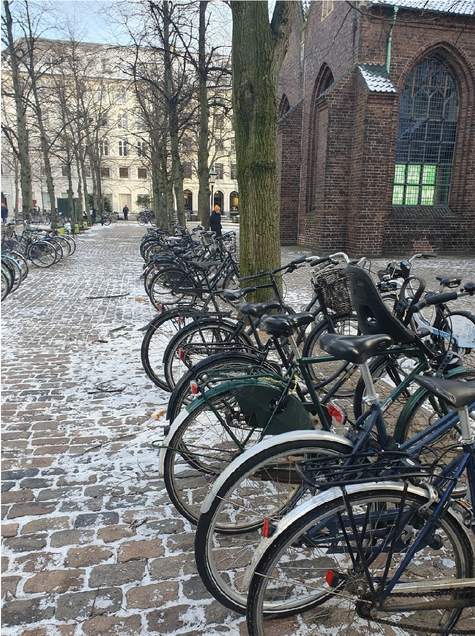
Sorte sadler på Nikolaj Plads: Reel dagparkering