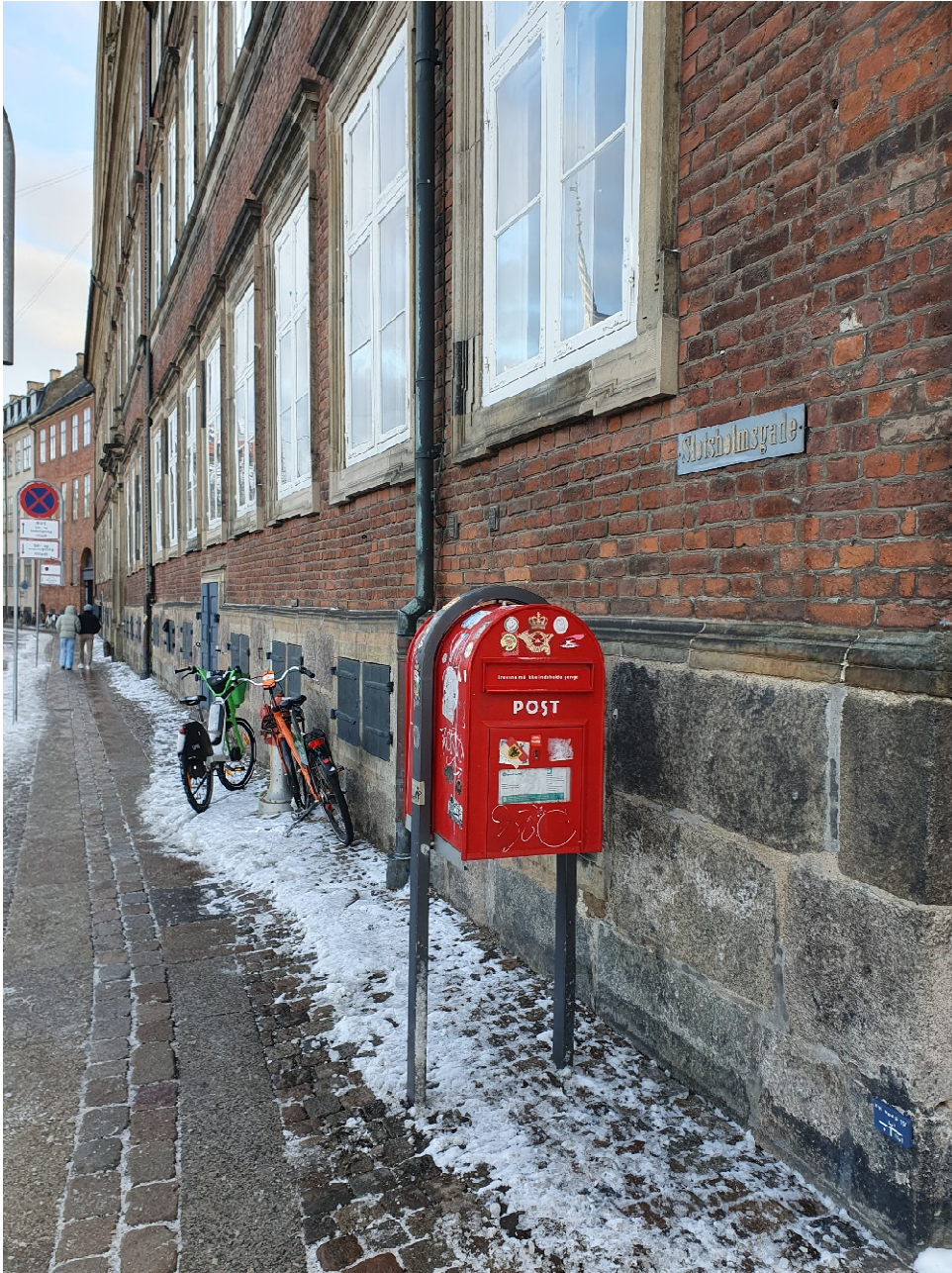
Slotsholmsgade: Snerydning vanskeliggjort af lejecykler efterladt uden for stativer