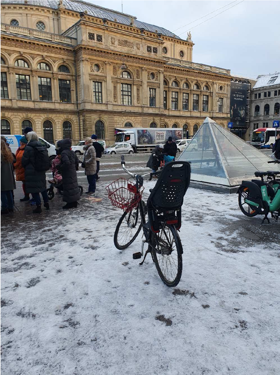
Cyklist signatur ved metroen på Kongens Nytorv: The Sovereign Bike Pop-Up Meme