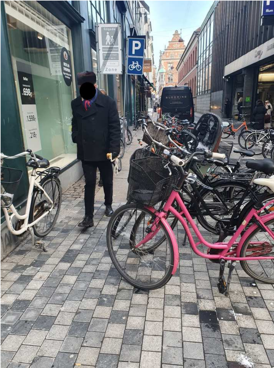
Silkegade: "Sluse" ved Illum, som lige akkurat tillader gående at komme igennem