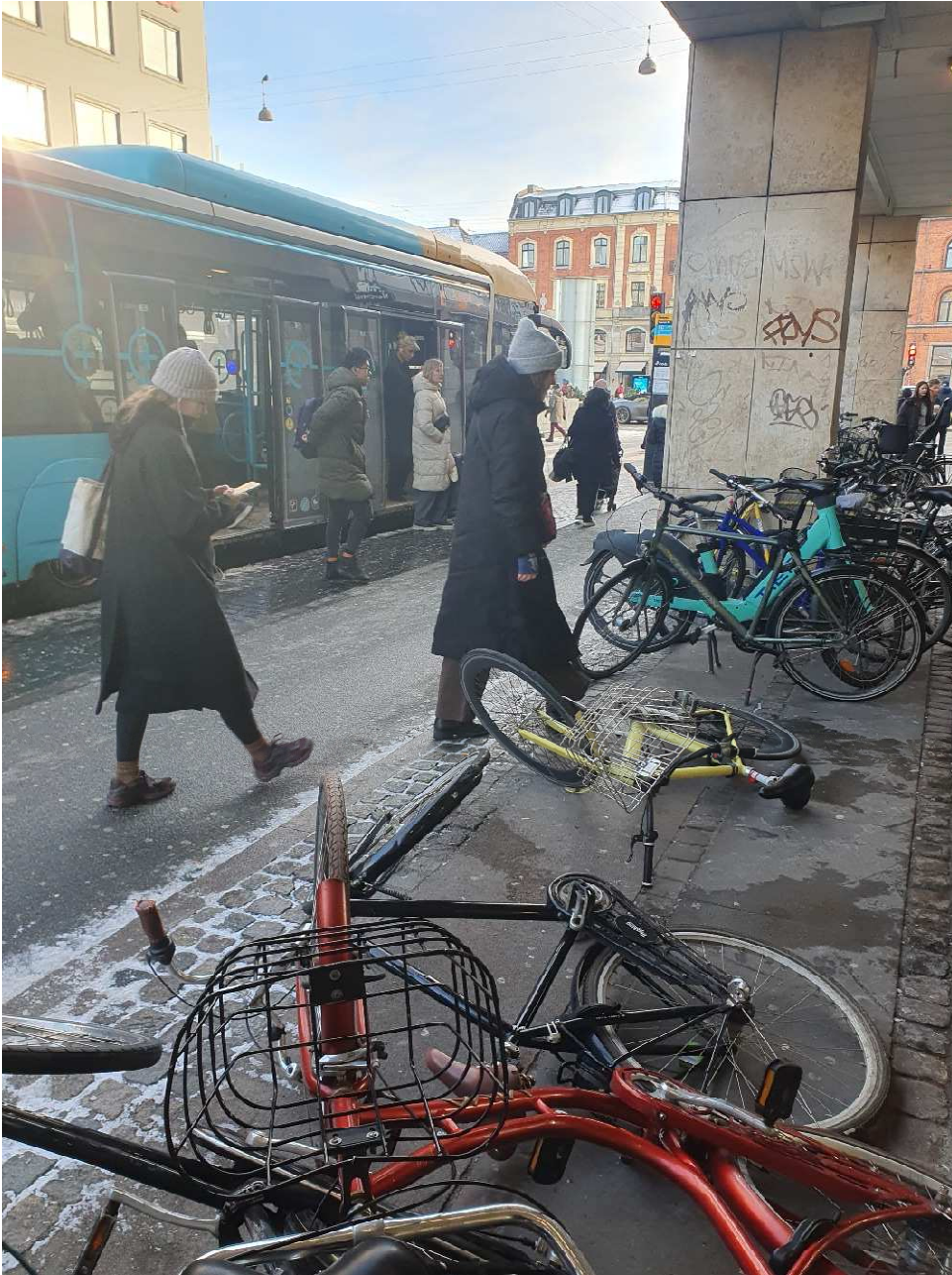
Frederiksborggade busstop: Topmålet af hensynsløs parkering