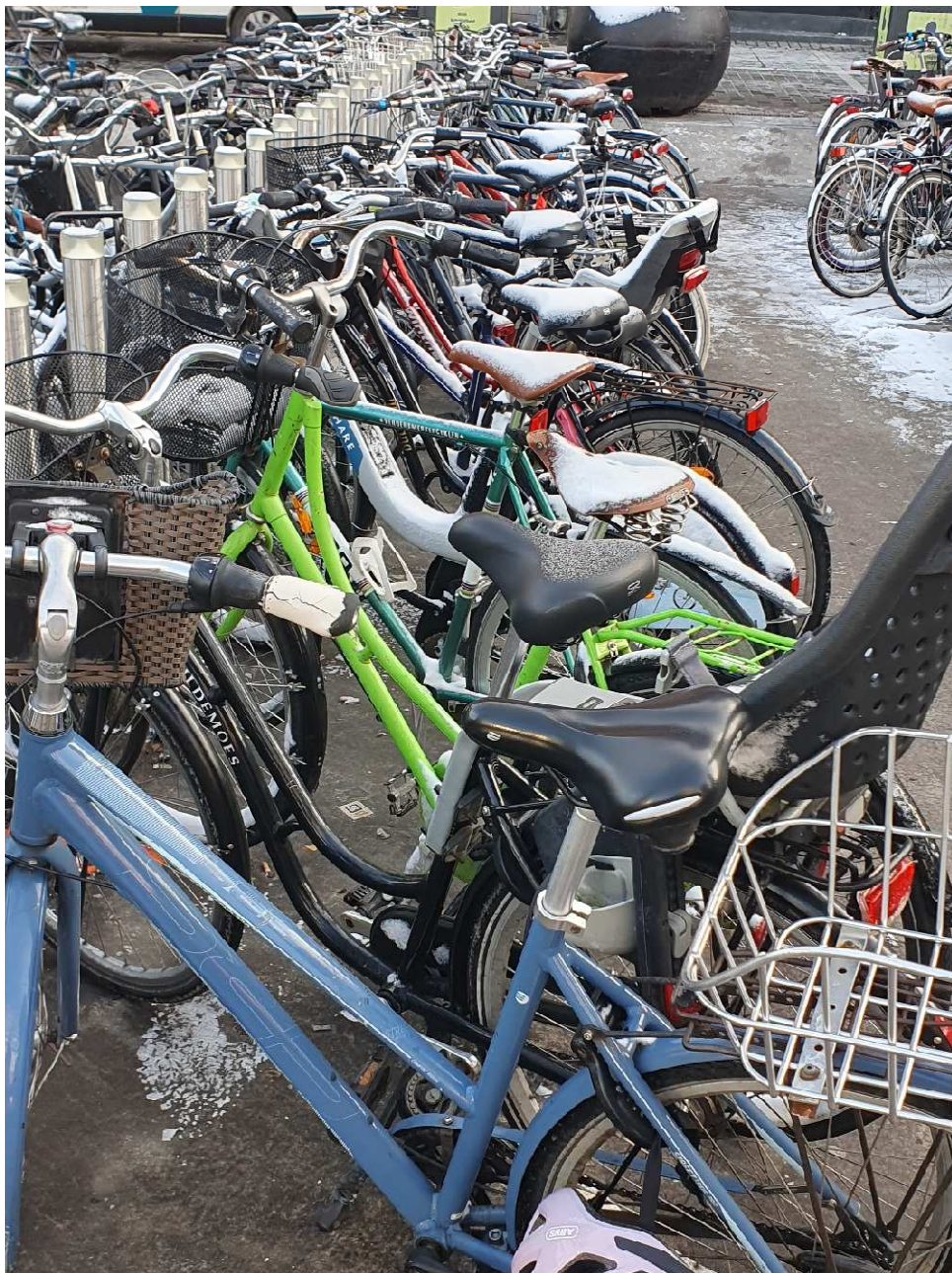
Nørreport prime parking: Lutter hvide sadler på nær de to forreste cykler, som nok er ankommet samme dag