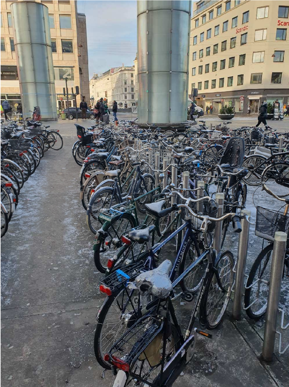
Nørreport: Hvid sadler og en enkelt herreløs cykel uden sadel