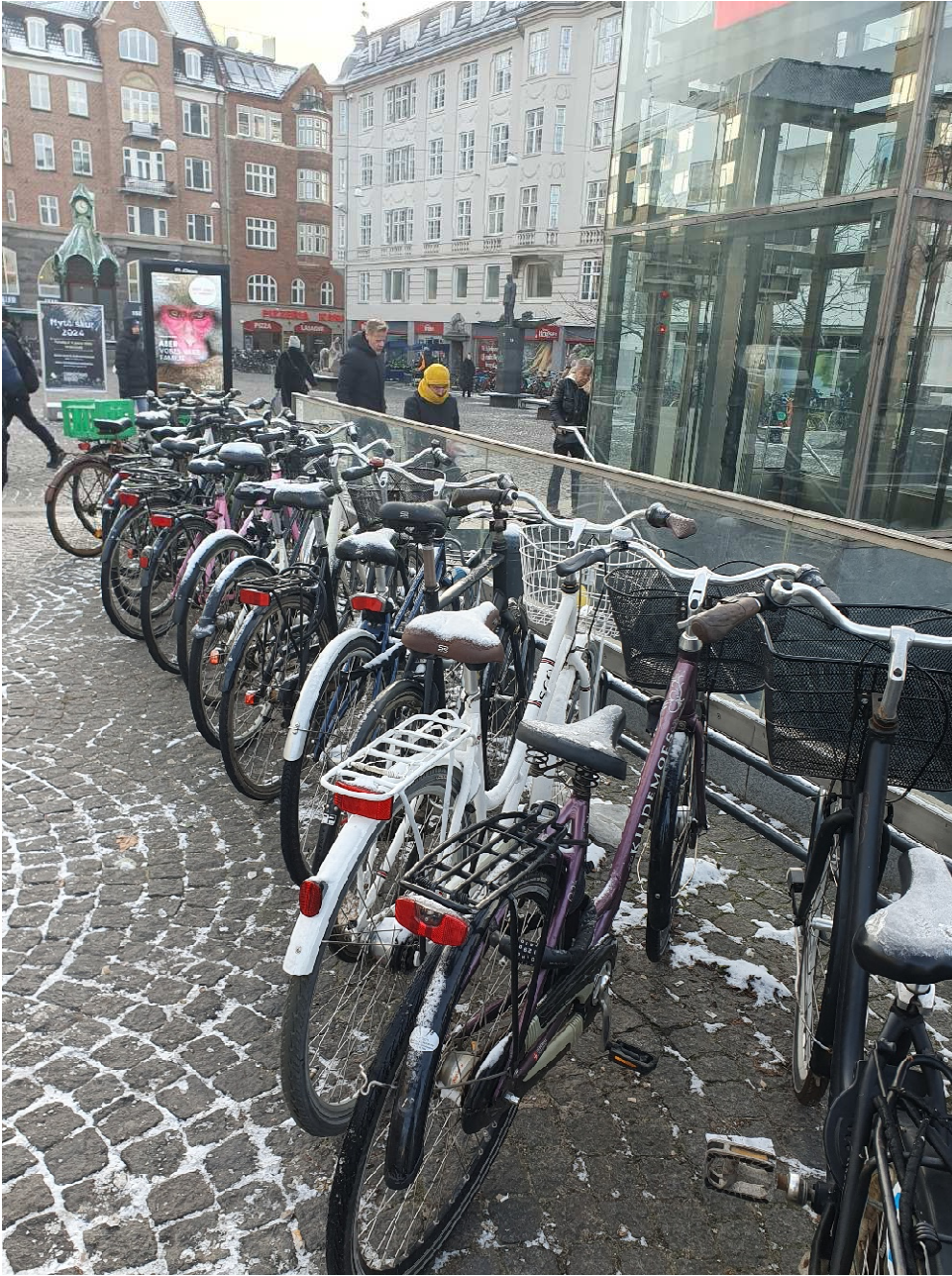
Christianshavn: Jo tættere på nedgangen, jo færre har taget cyklen denne dag.