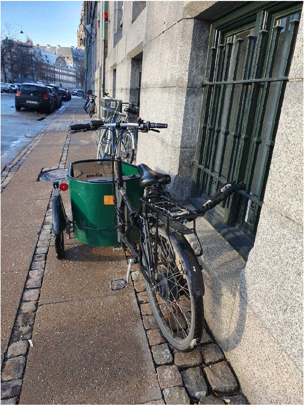
Slotsholmsgade: Hensynsløs parkering