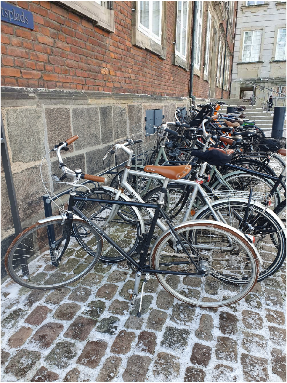
Regnedrengenes arbejdsheste ved Finansministeriet