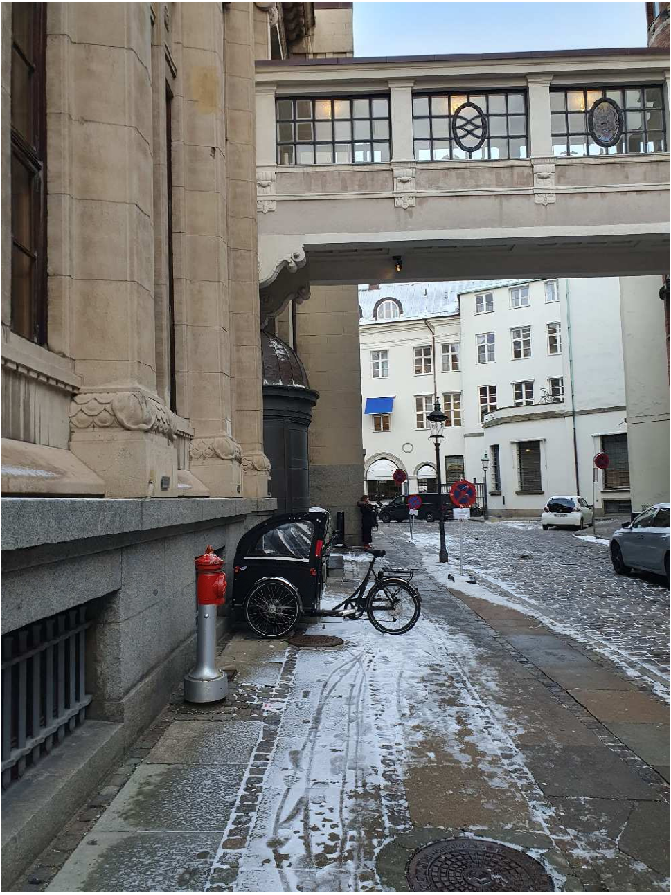
Fin cykel på fin adresse med nogen plads levnet til fodgængere