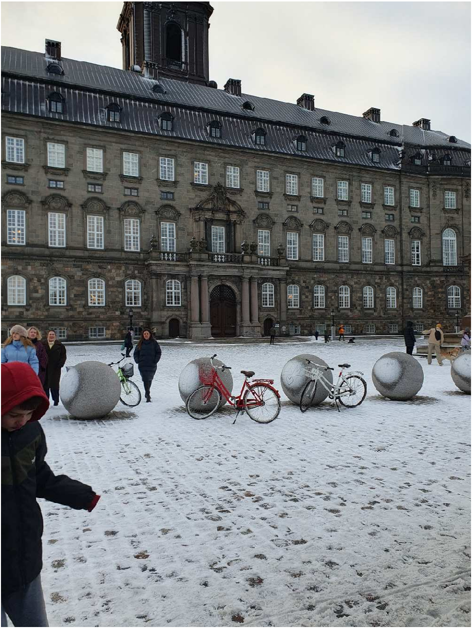
Stativfri parkering i venten på Dronningen.