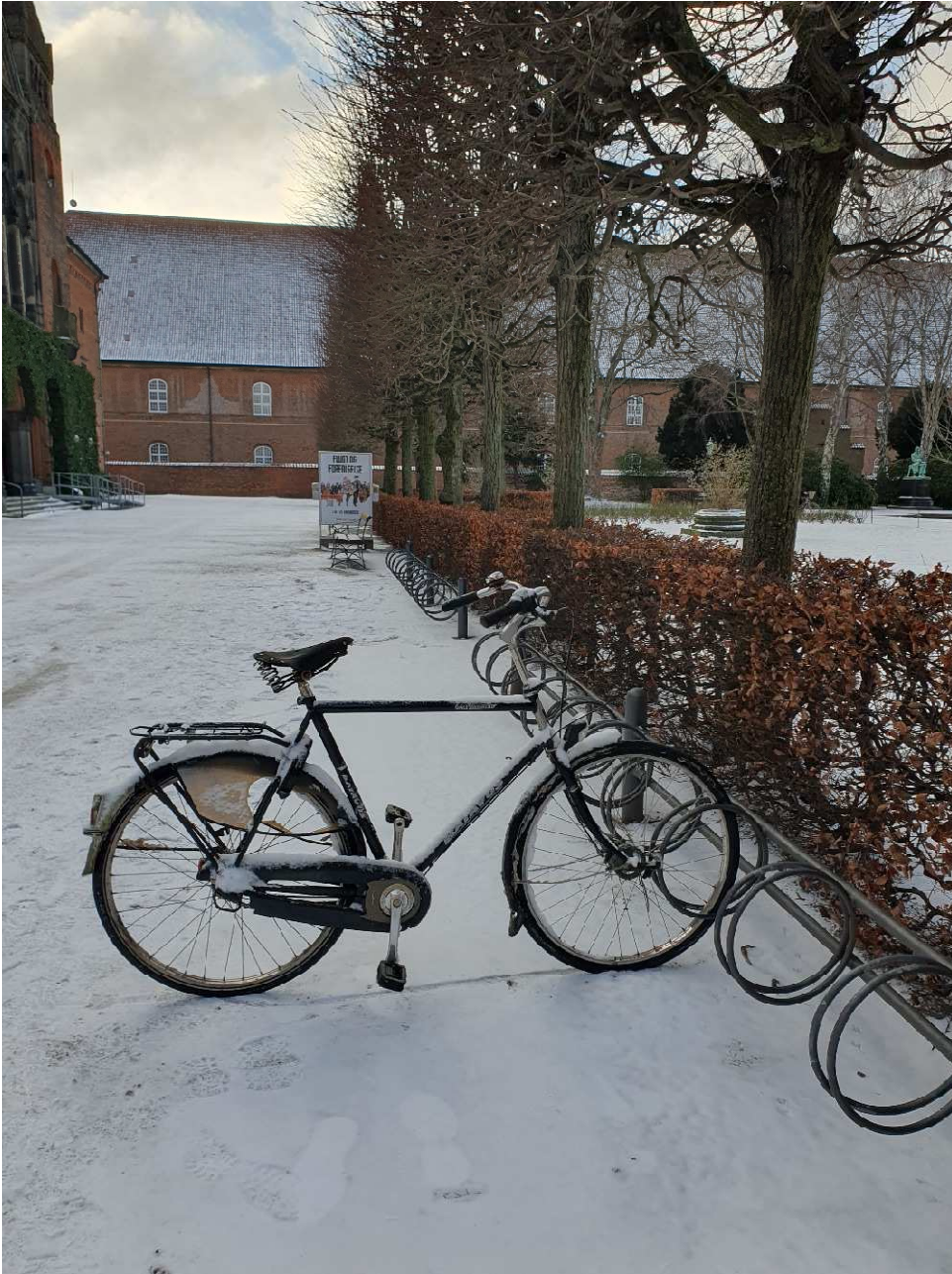
Bibliotekshaven: Kun én bruger på plads