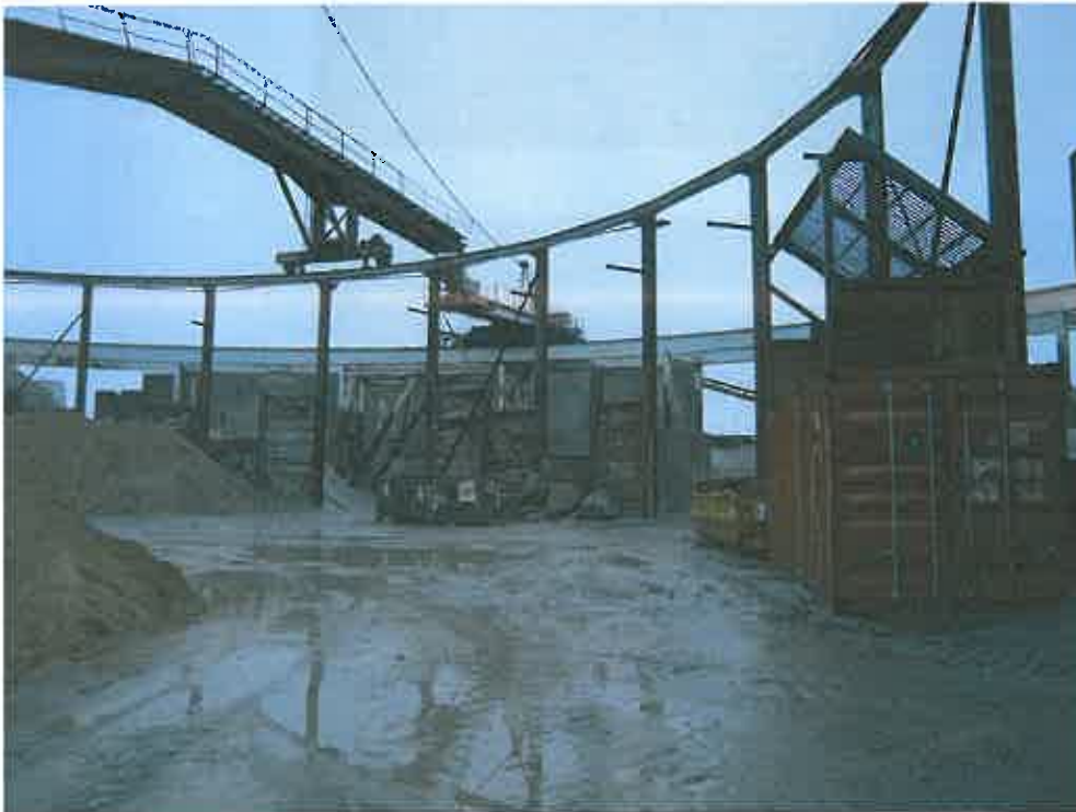
Billede 1 viser bulkanlægget indefra. Bemærk spor til transportbånd samt opdelinger til bulken.

Uden j.nr. Frihavnen, 1892. Fund af sammenrustede kanonkugler, sandsynligvis stammende fra skibet "Dannebrog", der sprængte i luften 2. april 1801 efter 4,5 times bombardement af britiske krigsskibe. Fra artikel i Nationaltidende af Rosenkjær, 1892. Uden j.nr. Frihavnen 1982. Fund af flintflækker og forbejdet hjortetak, desuden fund af flækkeblokke og flintaffald. Fra artikel i Nationaltidende af Rosenkjær, 1892. Uden j.nr. Nordhavn Station, 1986. Fund af humane knogler ved udgravning til elevator på Nordhavn Station. Note i Øbro Bladet 6/8-1986.