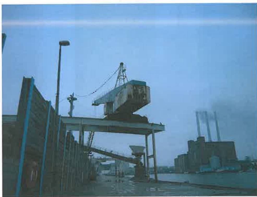
Billede 3 viser Kalkbrænderiløbskajen med kran og kranspor indtil bulkanlægget.