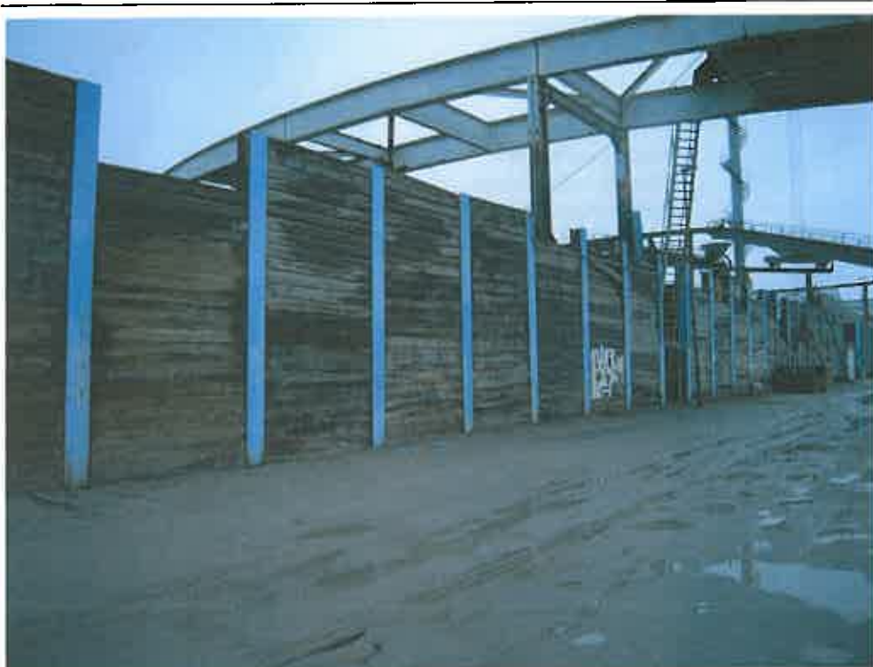
Billede 2 viser bulkanlægget ude fra Kalkbrænderiløbskaj.