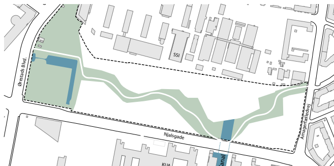
Cykelrute i grønt strøg slynges gennem bebyggelsen tangerende Njalsgade, og Emil Holms Kanal forlænges ind i området. (Arkitema)