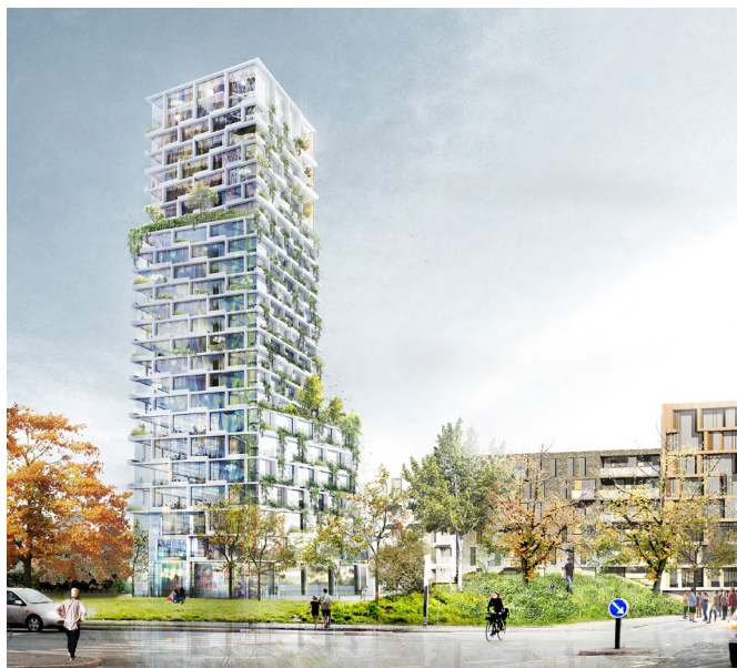
Identitetsbygning A, 86 m. Forventet anvendelse er hotel, boliger, erhverv eller kultur. (Arkitema)

Der er ingen bygninger på grunden, udover midlertidige pavillioner, og bebyggelsesmønstrene i den omkringliggende by er meget varierede. Mod øst og vest ligger brokvarterene med københavnerkarréer. Mod syd er Ørestad Nord som afsluttes med KUA 2's meget lineære bebyggelsesstruktur ud til Njalsgade og enderne af Ørestadens to kanaler. Statens Serums Institut (SSI) ligger nord for grunden og bygningerne her er også placeret inden for en lineær struktur, hvoraf flere af bygningerne er bevaringsværdige.