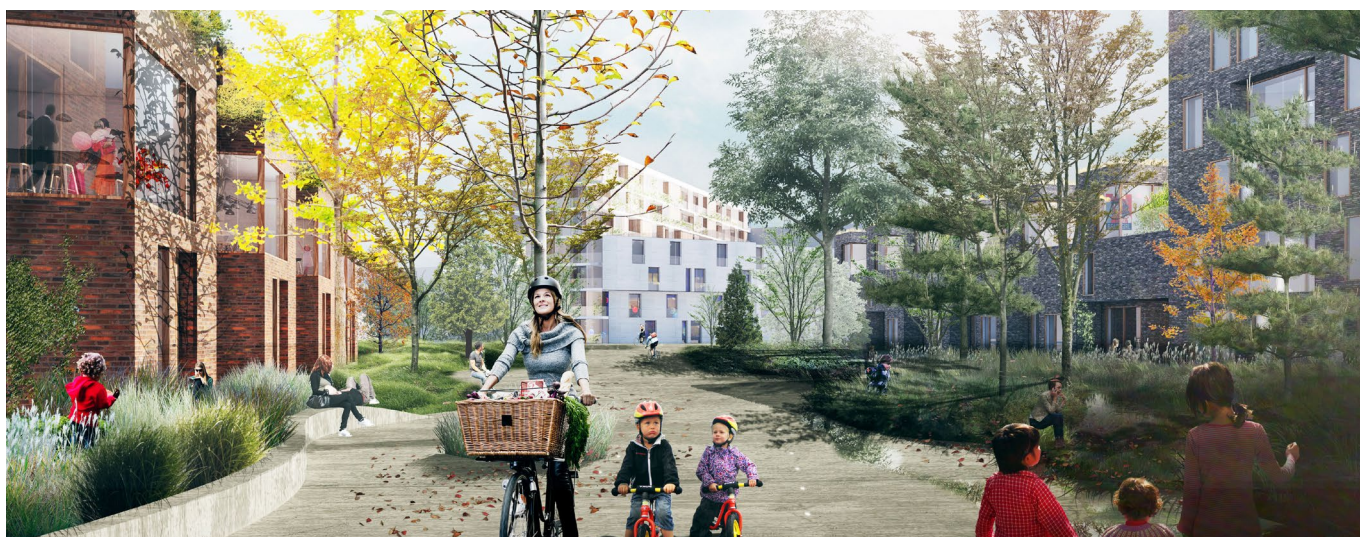
Visualisering af det grønne strøg (Tredje Natur)