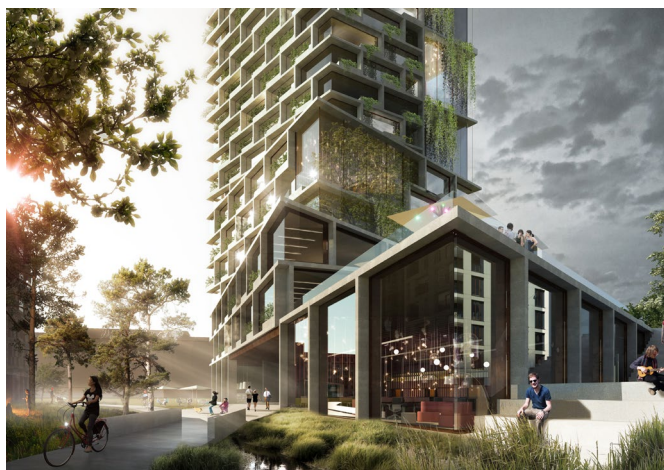
Identitetsbygning A, med udadvendte kantzoner ud til det grønne strøg samt offentligt tilgængelige tagflader op til 3. etage. (Arkitema)