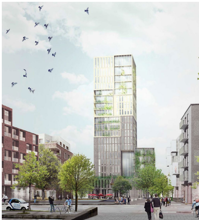
Identitetsbygning B, 70 m. Forventet anvendelse er boliger. (Entasis)