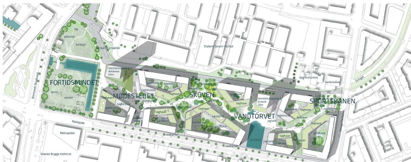
Helhedsplan (Arkitema og Tredje Natur)