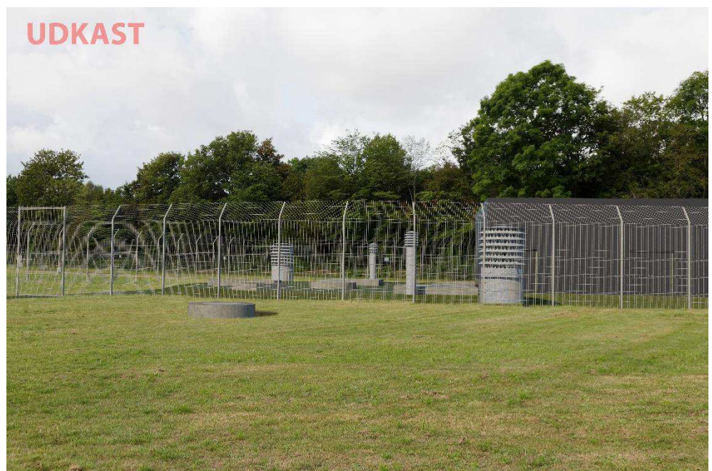
Figur 5-1 Visualisering af overjordiske konstruktioner ved skakten, hvor det øverste billede viser de nuværende forhold og det nederste billede viser en mulig udformning og placering af teknikbygning, adgangsvej, dæksler og udluftningsrør.