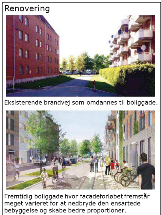
Eksisterende brandvej som omdannes til boliggade.