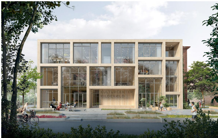
Visualisering, Kulturcenter Kildevælds front mod Kildevældsparken