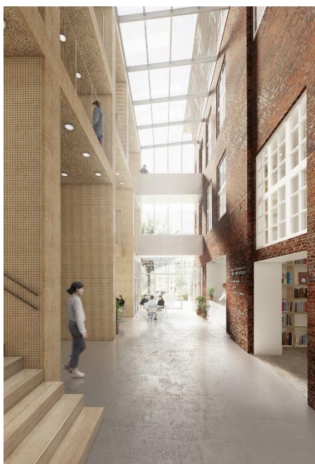
Visualisering, Kulturcenter Kildevæld