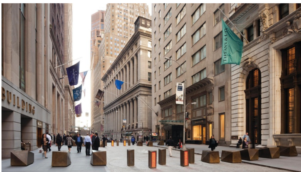
New York, "No-Go" Rogers Partners Architects+Urban Designers