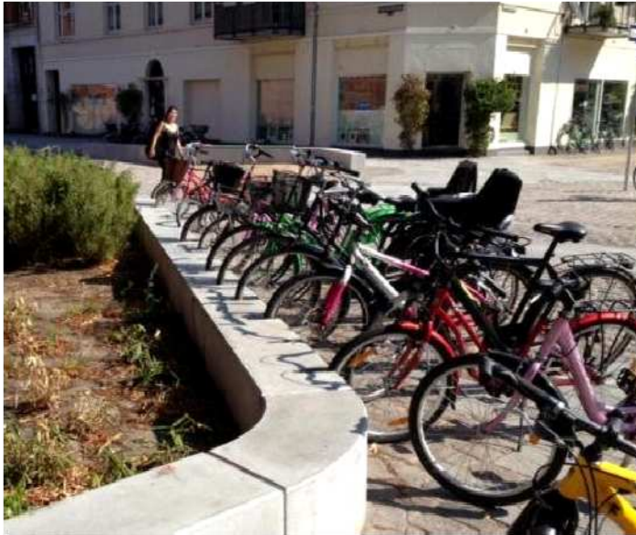
Tove Ditlevsens Plads