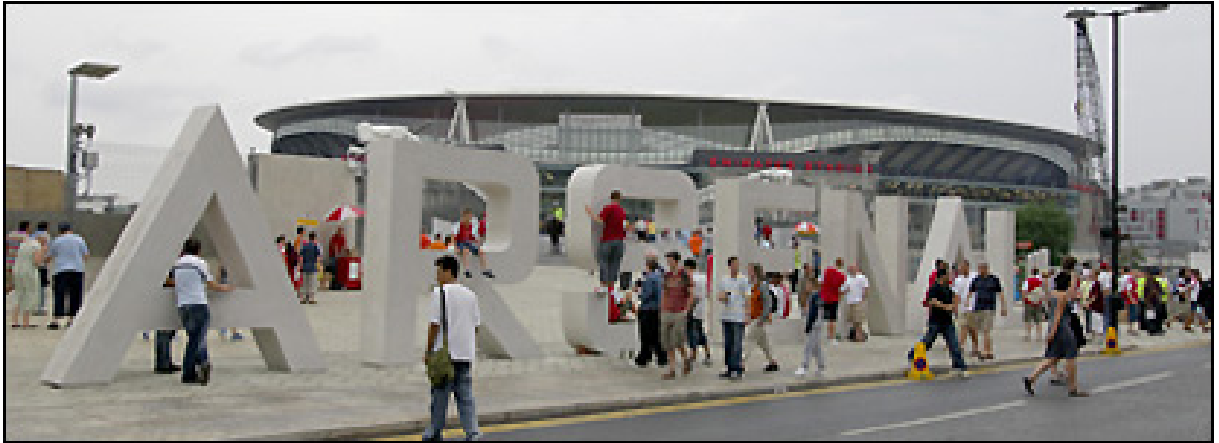
Fodboldklubben Arsenal's navn i beton