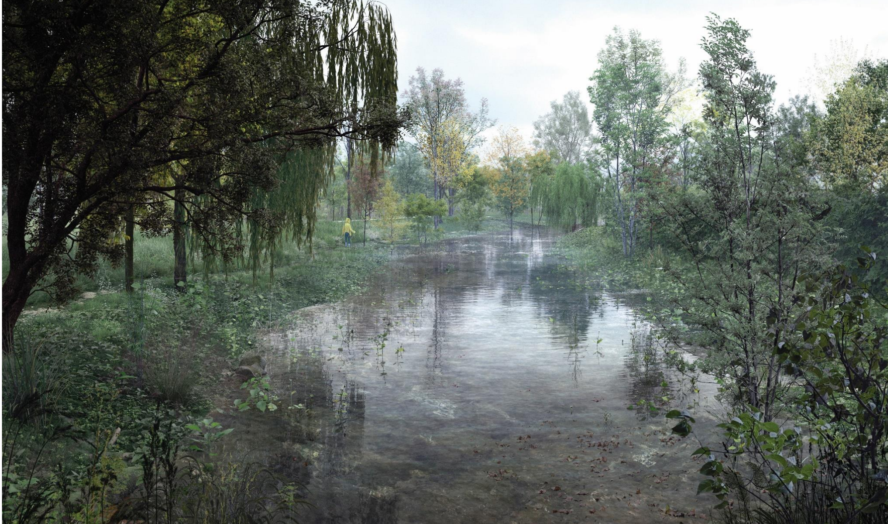
Visualisering er udarbejdet af SLA og Aesthetica

Fremtidige forhold, visualisering: Maksimal vandstand i åen inden den går over sine brinker og inden oversvømmelsesarealerne i parken tages i brug.