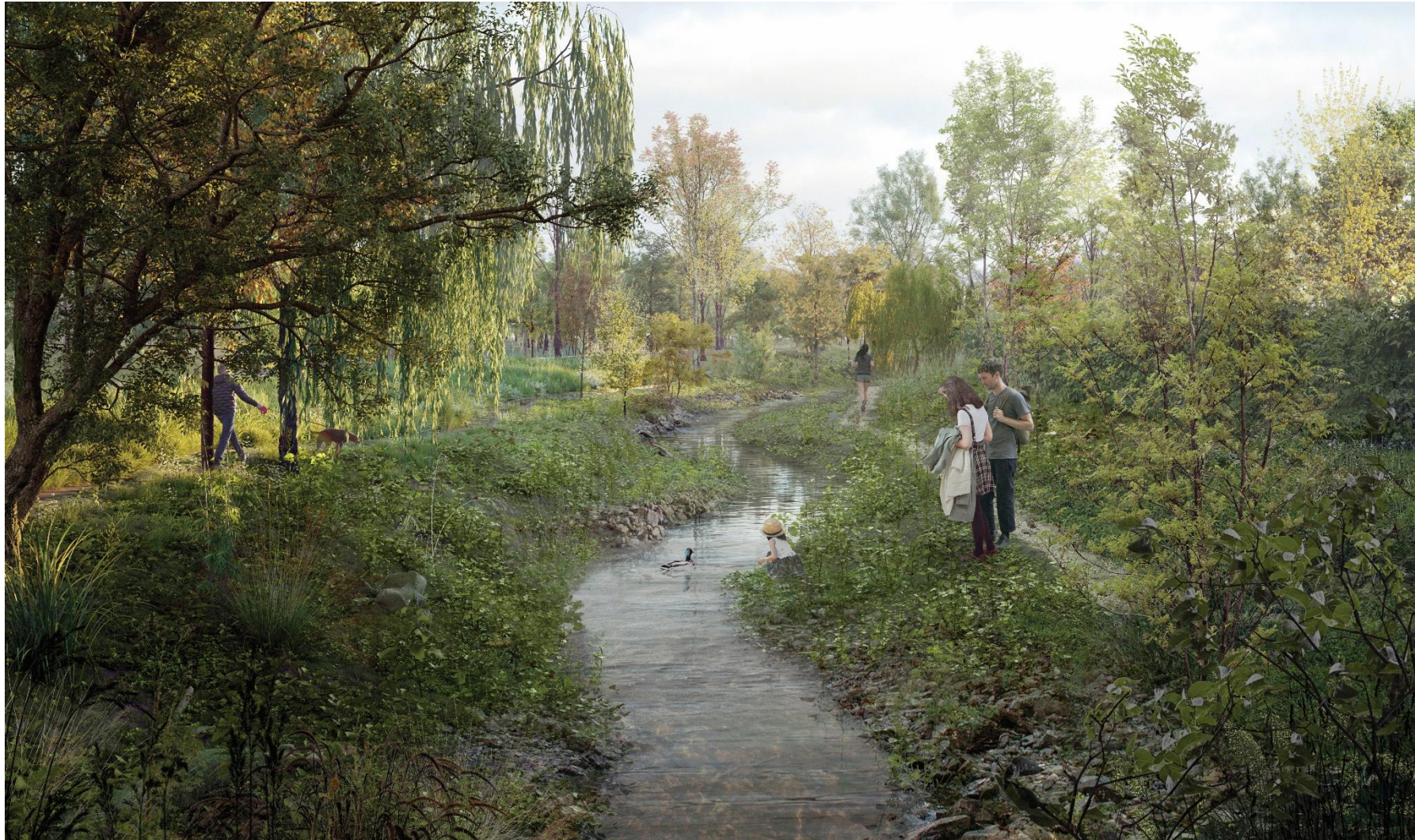
Visualisering er udarbejdet af SLA og Aesthetica