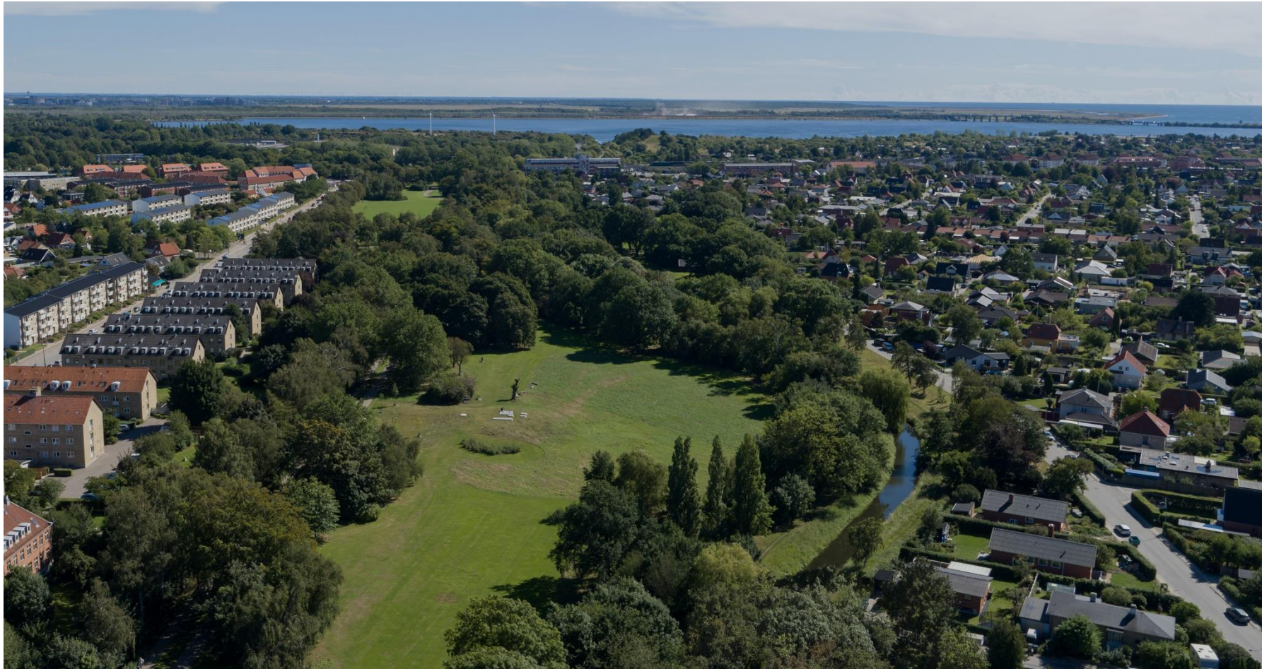
Dronefoto, 2020, Aesthetica

Eksisterende forhold: Kig udover den sydlige del af Vigerslevparken, som den er i dag: Harrestrup Å løber i et bredt lige forløb i parkens kant. I store dele af parken er åen ikke synlig for parkens brugere, det gør sig også gældende i denne del.