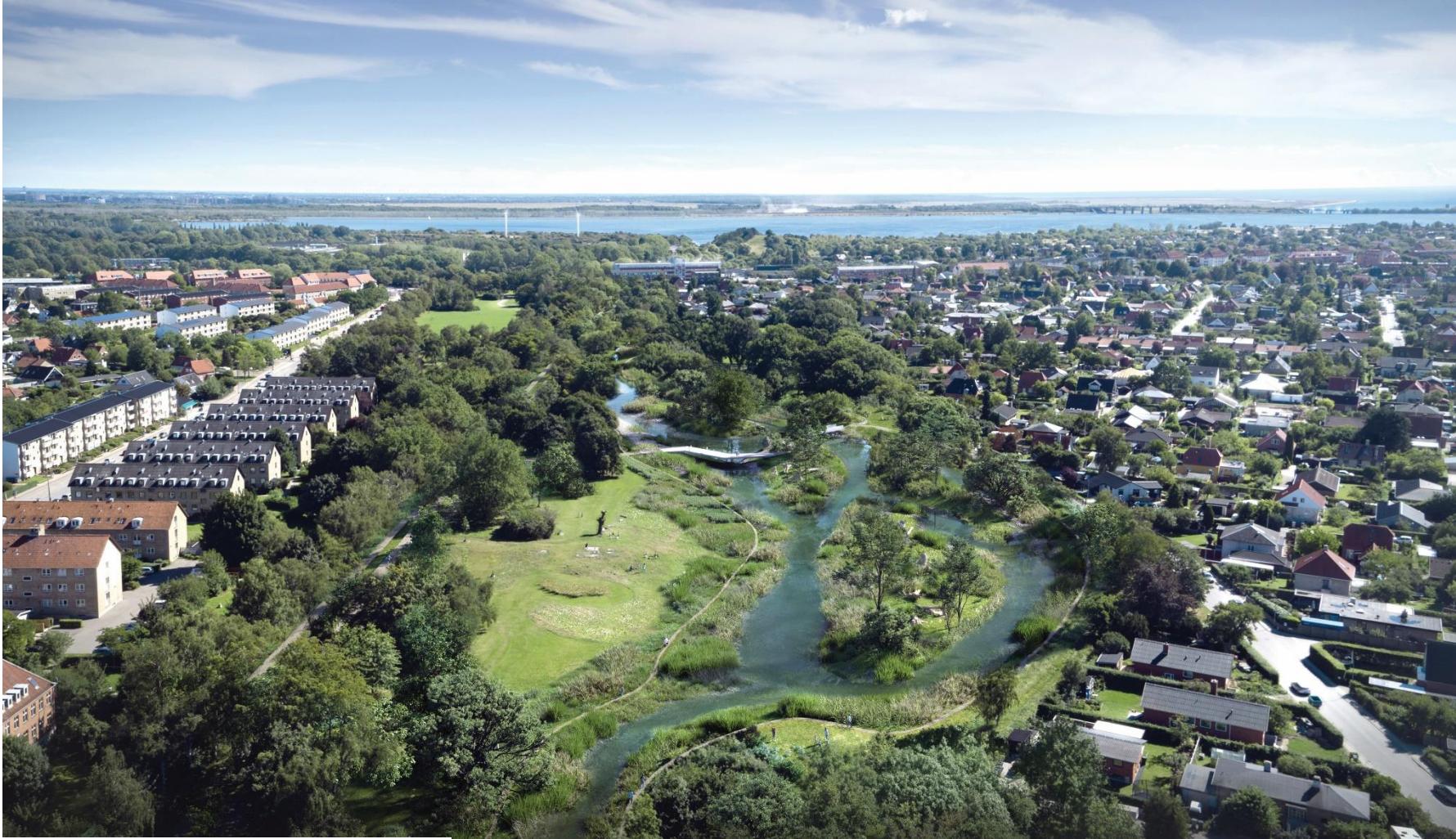
Visualisering er udarbejdet af SLA og Aesthetica

Fremtidige forhold, visualisering: Visualiseringen viser vandløbet ved en normal vandstand. Åen er udvidet og å-tracéet slynget i et mere naturligt forløb. I skybrudssituationer sikrer terrænbearbejdnings, at oversvømmelser fra åen holdes i parken. Visualiseringen viser området, hvor beplantningen er vokset til efter anlægsarbejderne er afsluttet efter en årrække.