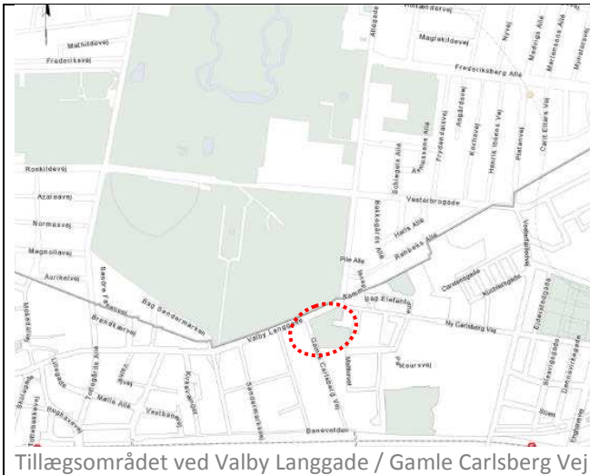
Tillægsområdet ved Valby Langgade / Gamle Carlsberg Vej