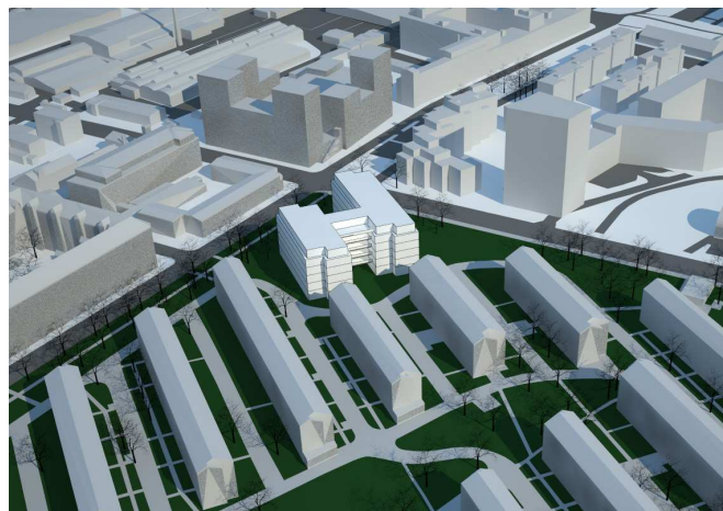
Volumenmodel. Plejecentret ønskes udført i 6 etager og 20 m højt. Højden lægger sig op ad karrébebyggelserne nord for området, der er ca. 21 m høje. Det eksisterende Sundparken er 16 m højt med 4 etager + tagopbygning. Visualisering af Sangberg.

Skygger fra nybebyggelsen falder primært over egne arealer og vejarealer. Den nye bebyggelse vurderes ikke at medføre væsentligt ændrede vindhold. Skyggevirksomheder og vindforhold vil indgå i den videre udvikling af projektet, herunder i forhold til at sikre gode lys- og vindforhold i indretning af plejeboliger og opholdsarealer.