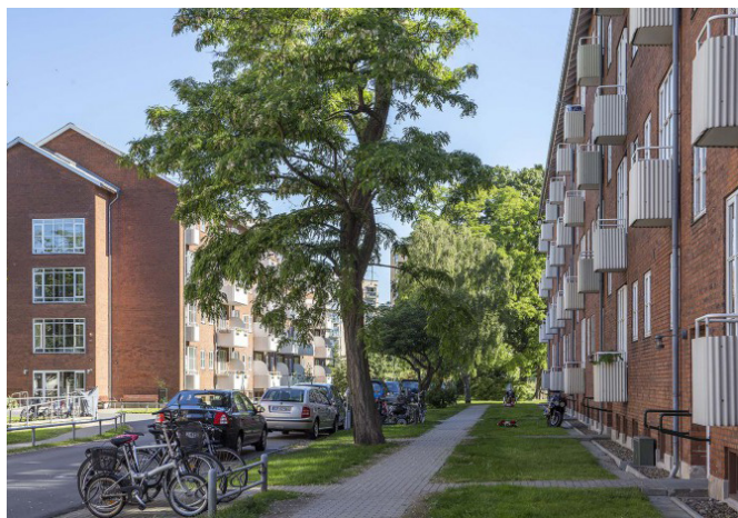
Det eksisterende Sundparken fremstår som parkbebyggelse med grønt mellem bygningerne. Plejecentret ønskes udført overvejende med røde tegl/teglskaller og med hvide vinduesrammer i overensstemmelse med egenarten i Sundparken.

Adgang til området skal ske fra de omgivende gader samt via de interne fællesveje i området. Området er beliggende stationsnært med ca. 350 meter til metrostation Lergravsparken, hvor der også er flere buslinjer.