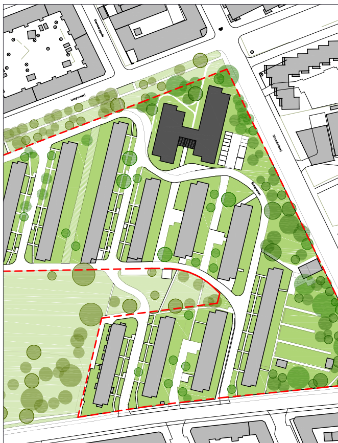
Situationsplan. Plejecentret ønskes placeret tilbagetrukket med grønt omkring bygningen. Placering og indretning af adgang, parkering og haverum er principiel og skal afklares nærmere i det videre forløb. Illustration af Sangberg.

Ved udvikling af 'En levende by' prioriteres hverdagslivet først. Det betyder fx, at når man cykler, skal der være