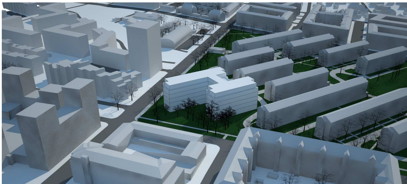
Volumenmodel. Øverste 1-2 etager skal have en særlig bearbejdning med tilbagetrækning mv. med fokus på at formidle overgangen mellem det eksisterende Sundparken og den omkringliggende by. Visualisering af Sangberg.