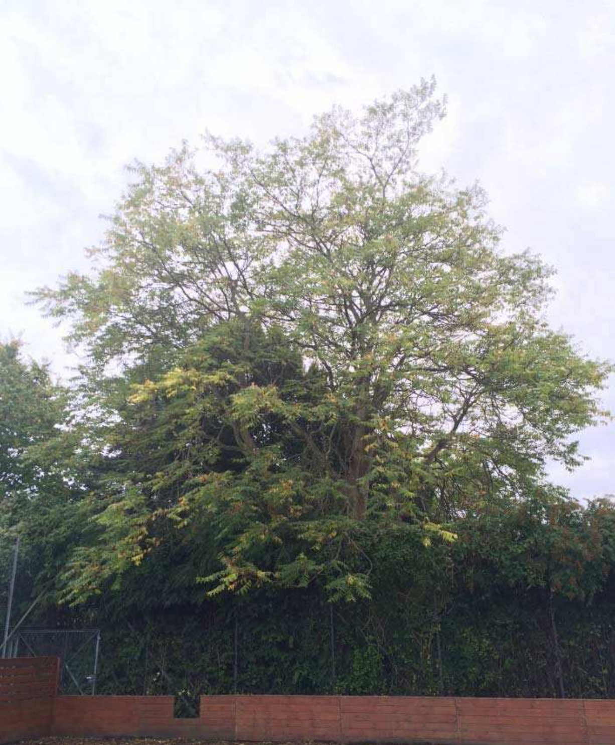
Eksisterende bevaringsværdige træ, skyrækker, set fra nordøst (TK Ungdomsgård).