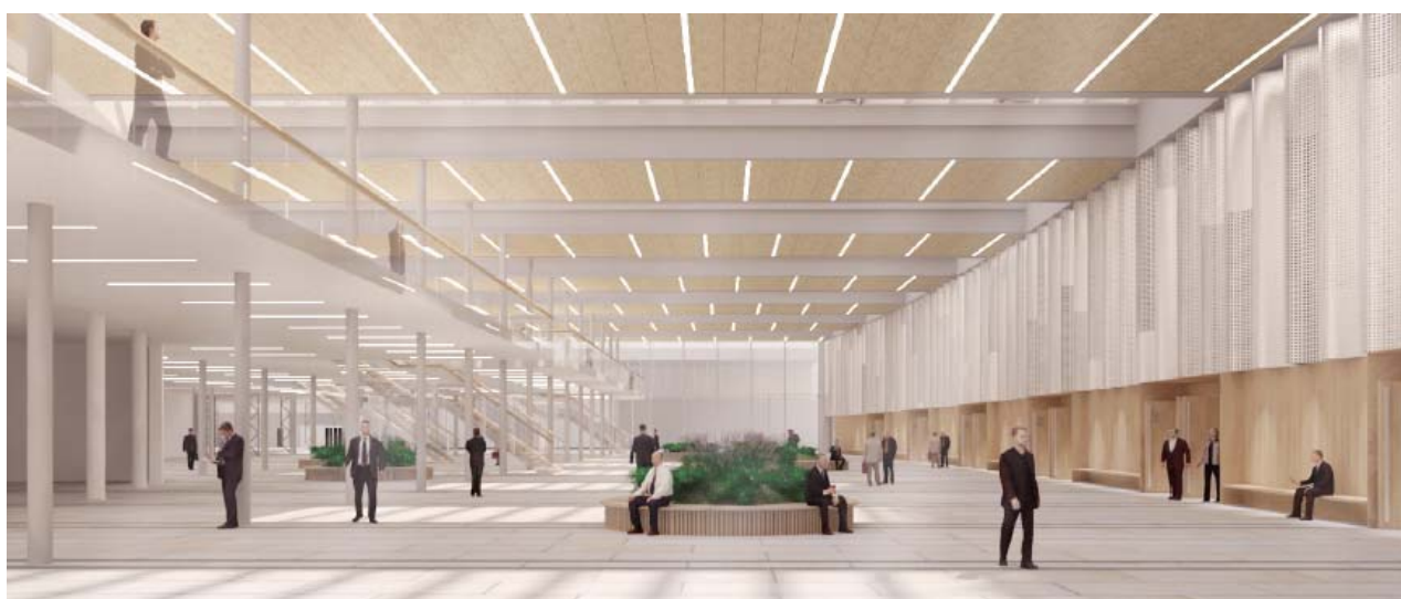
Foreløbig illustration af vandrehal