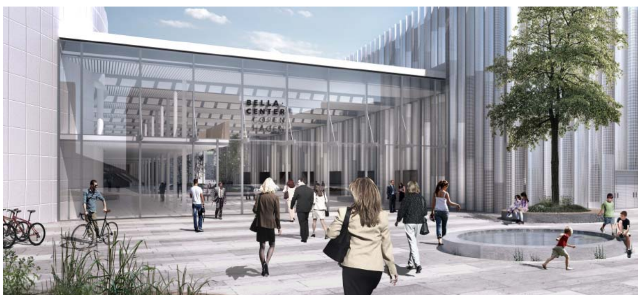
Foreløbig Illustration af ny hovedindgang til Bella Center Copenhagen fra dispositionsforslaget

Den delvis offentlige forbindelsen gennem Bella Center's fremtidige facilitet er illustreret på nedenstående