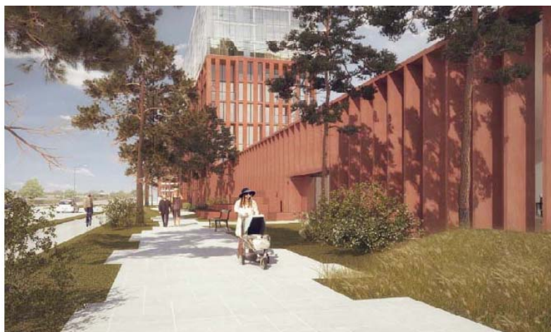
Illustration af den fremtidige grønne forbindelse omkring centeret