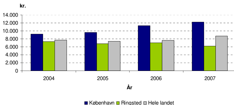
Figur: Udviklingen i kommunale udgifter pr. sygedagpengeforløb, 2004-2007

Ringsted Kommune har – som en af ganske få kommuner – formået at afkorte sagsvarigheden på sygedagpengeområdet. Ringsted har således nedbragt sine udgifter pr. sygedagpengeforløb fra 7.300 i 2004 til ca. 6.200 kr. pr. sygedagpengeforløb i 2007 og ligger væsentligt under landsgennemsnittet, der var på 8.600 kr. pr. sygedagpengeforløb i 2007. I København er udgifterne steget fra ca. 9.200 kr. i 2004 til ca. 12.200 kr. i 2007.