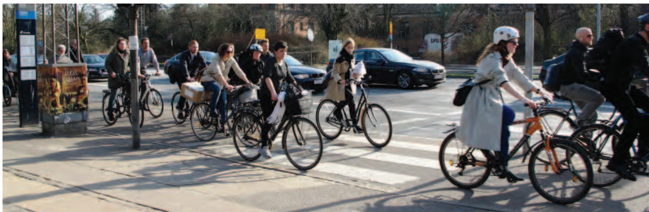
Indre By Lokaludvalg