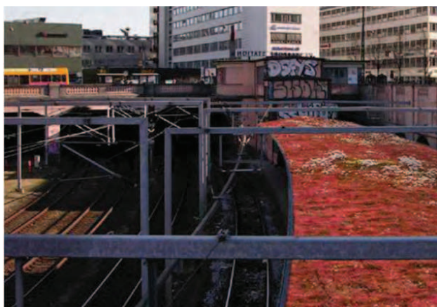
På billedet ses en animation af Vesterport Station med grønt tag.