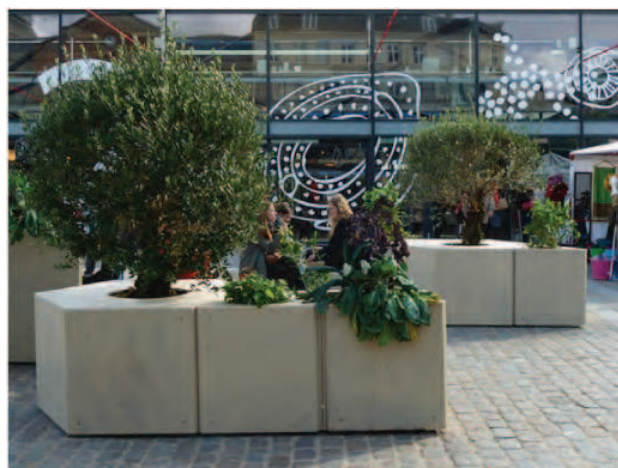
Miljøpunktets eksisterende mobile træer.

Bund laves af rør, f.eks. af isolationsrør; der bruges i industrien og til undergrunden. Heri kan stilles laurbærtræ eller buskbom og andet stedegrønt. Træpladerne samles af to dele og låser konstruktionen, og træerne kan ikke flyttes. Det gør dem nemme at opstille og besværliggør tyveri.