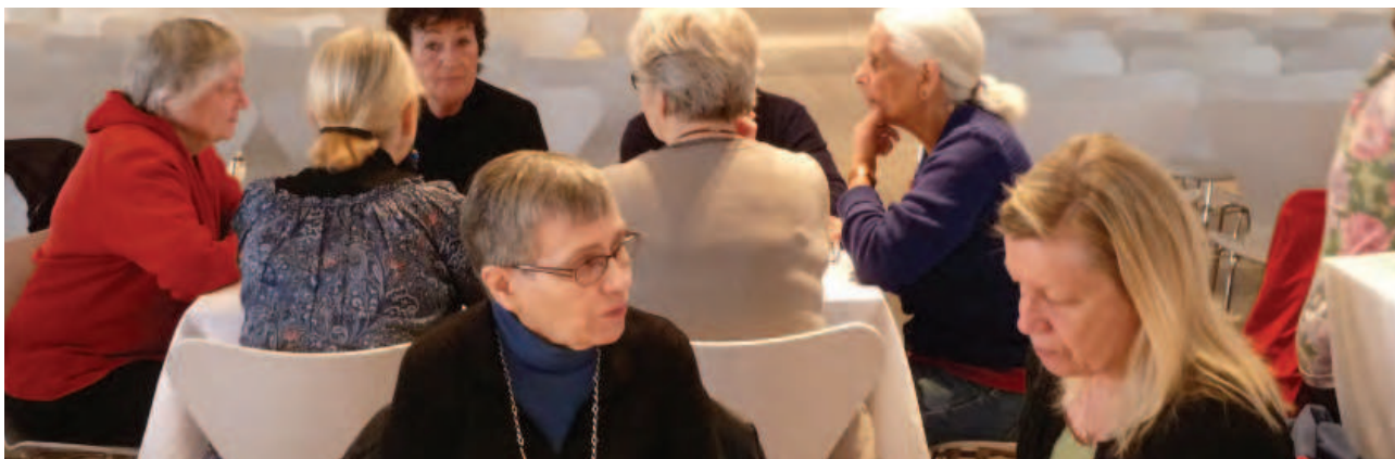
Indre By Lokaludvalg