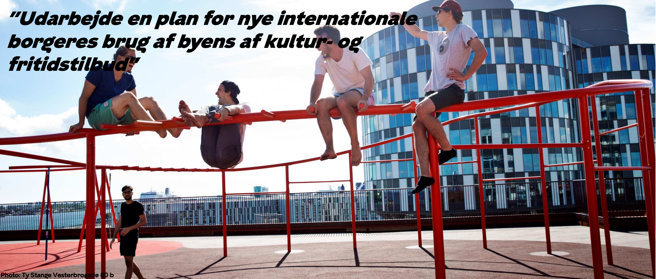
Vesterbrogade 80 b

“Udarbejde en plan for nye internationale borgeres brug af byens af kultur- og fritidstilbud”