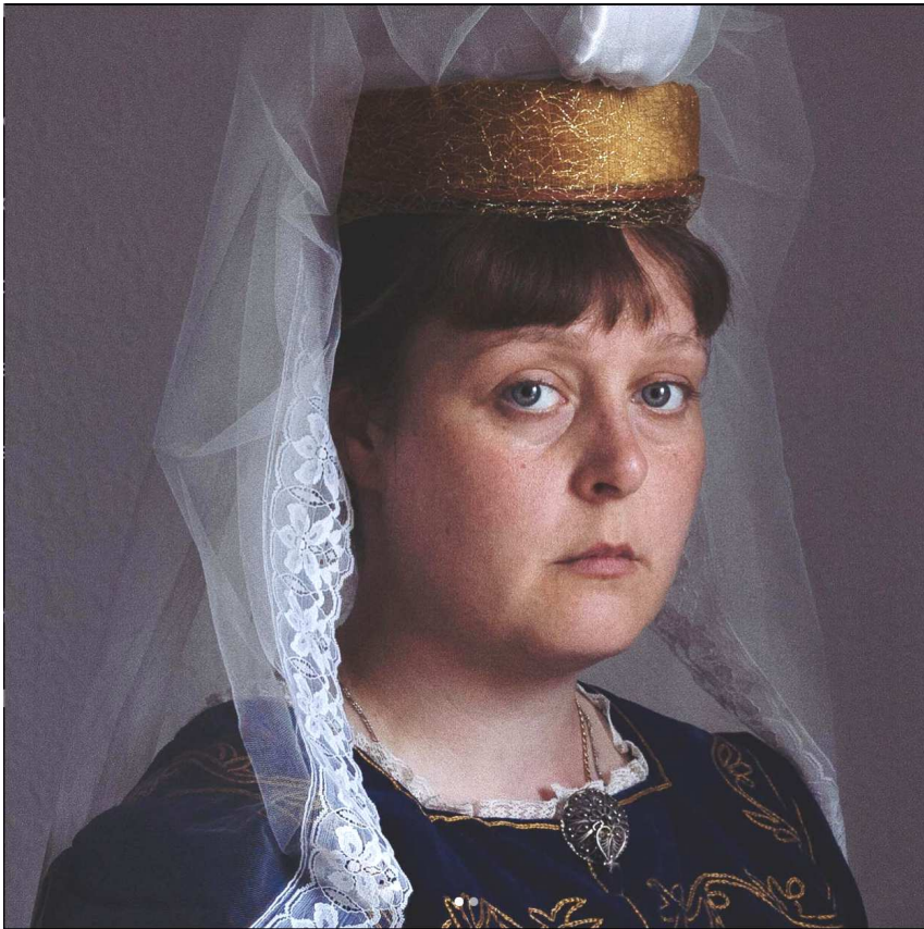
Udsnit fra et af selvportræterne