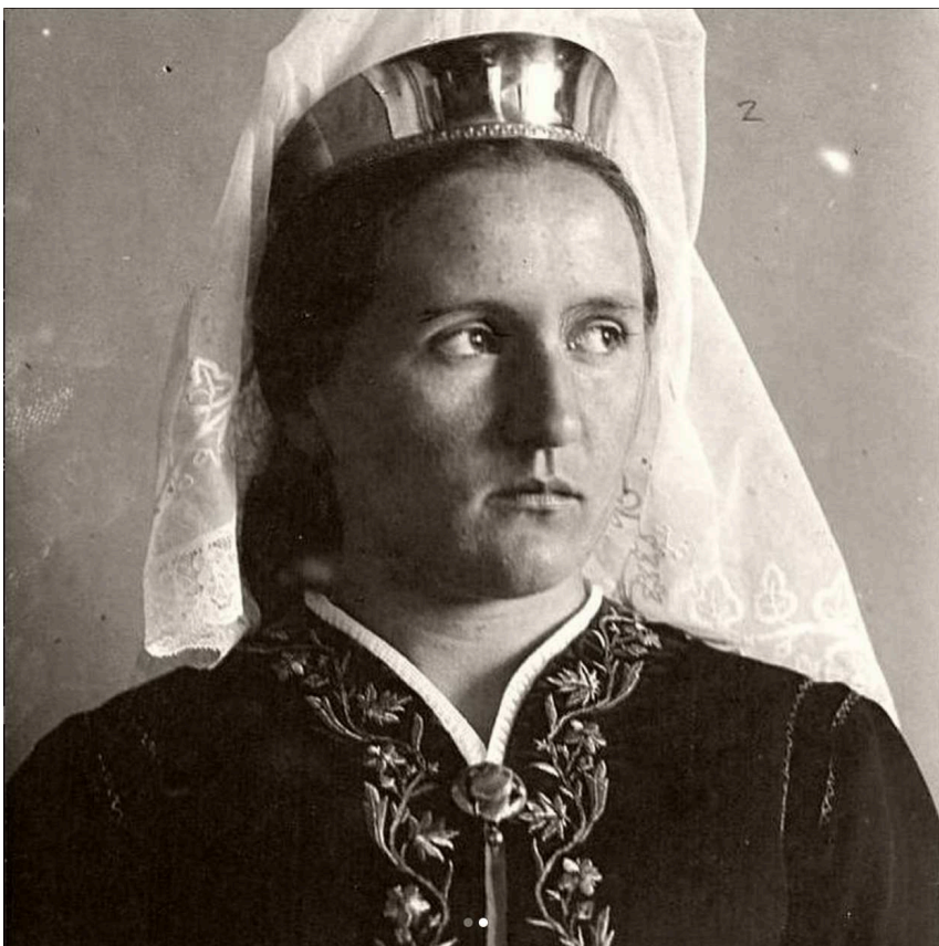
Daniel Bruuns portræt af 'Islænderinde i dragt'