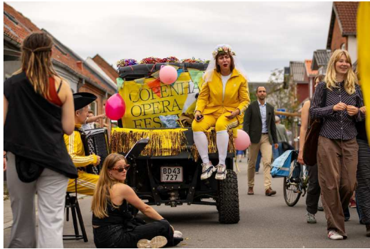
Ride, Sing, Repeat fra ladet af en traktor på 'Kultur mødet på Mors' 2023

“Vi har lige hørt nogle operasangere. Vi går ellers bestemt ikke og lytter til opera til dagligt, men det der var sgu fedt!”