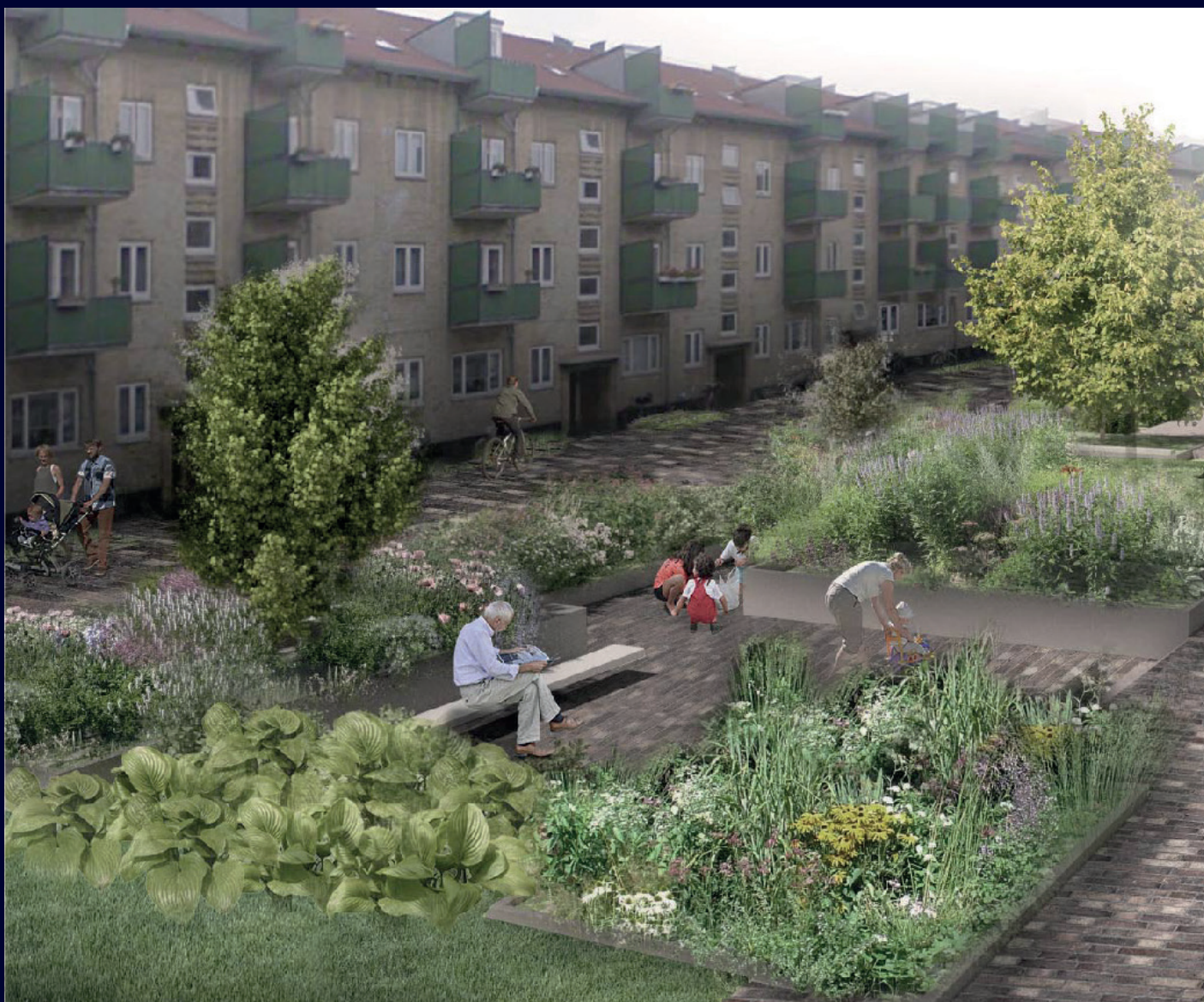
Illustration af den fremtidige gårdhave