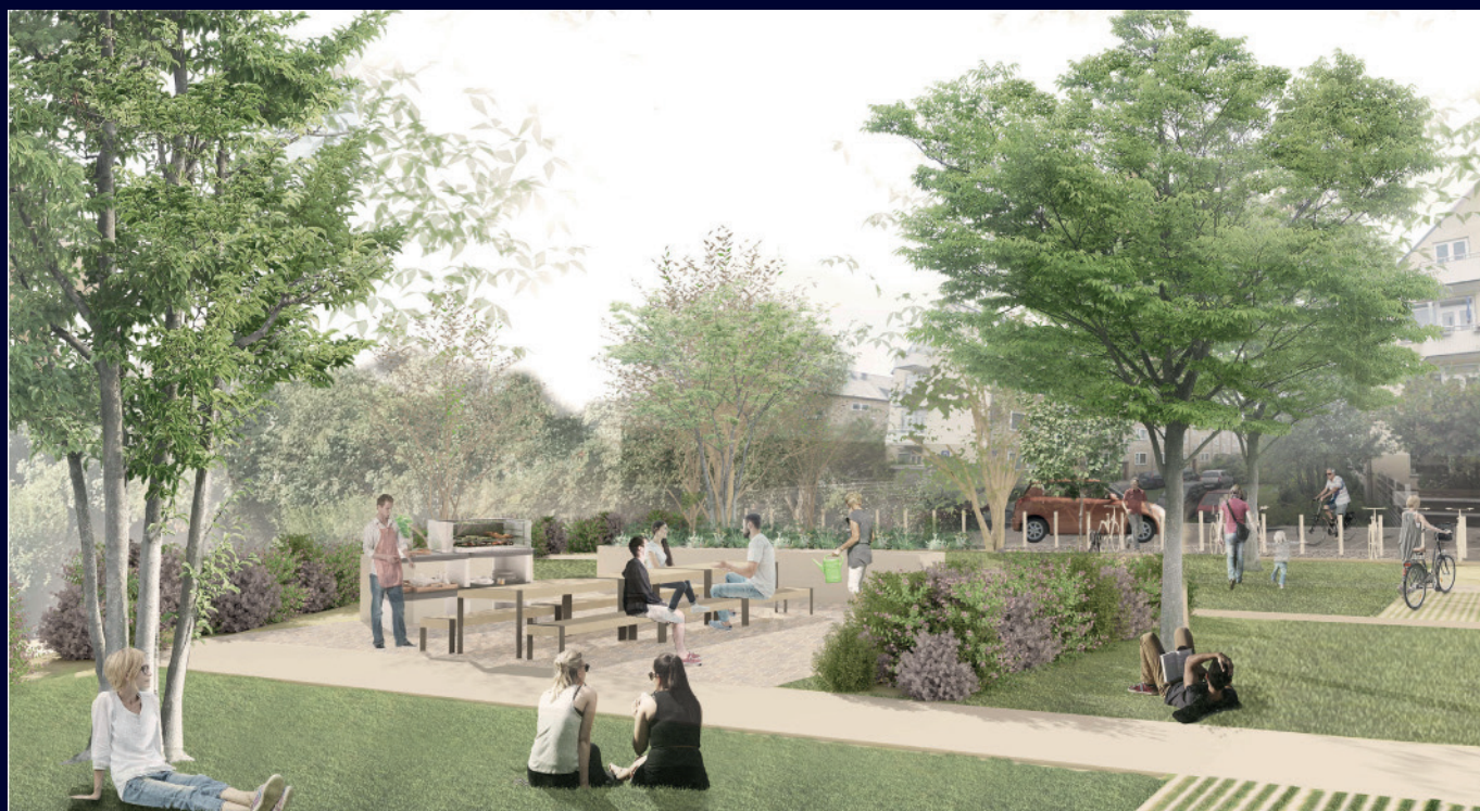
Illustration af den fremtidige gårdhave