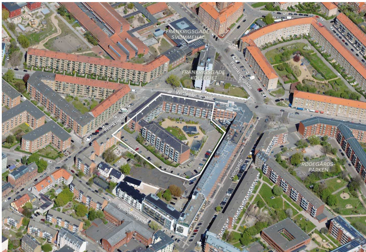
Området set mod nord. Lokalplanområdet er indtegnet med hvid linje, og de vigtigste gader og bygninger er navngivet.

Byggeriet ønskes opført på Frankrigsgade 28-48B, København S. Området er 7791 m 2 . I det foreslåede projekt medfører en inddragelse af tagetage til boliger en bebyggelsesprocent på ca. 130.