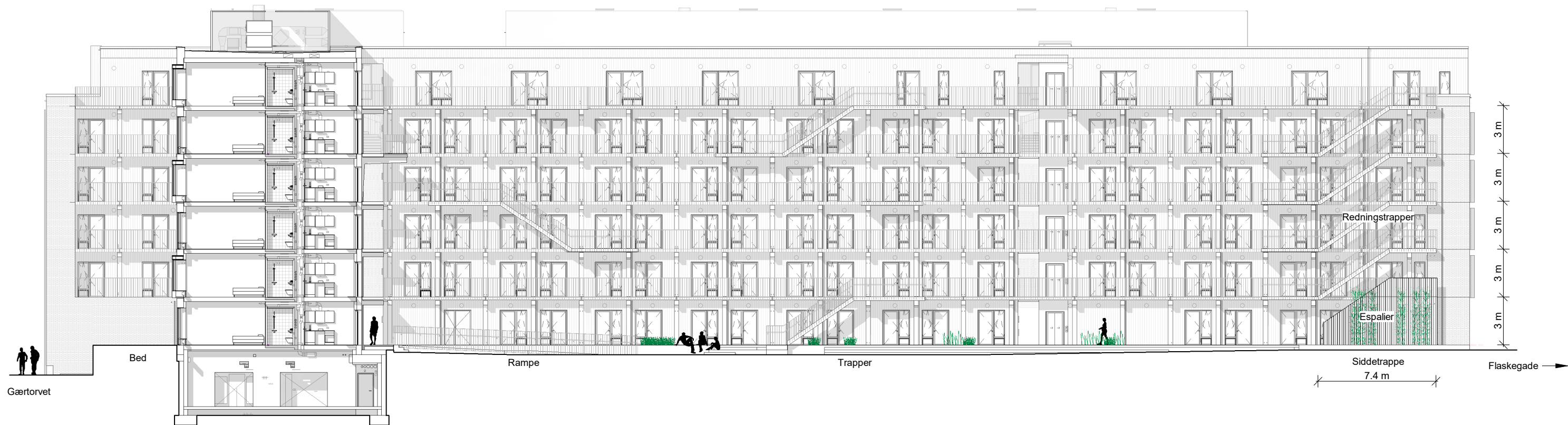
Gårdfacade B-B Mål 1 : 250