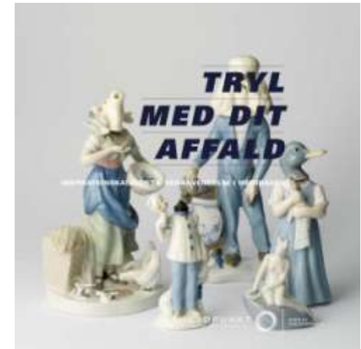
Forsiden fra Miljøpunktets inspirationskatalog Tryl med dit affald, som danner grundlag for kommende workshops om affald og ressource.

Nedenfor følger en konkretisering af projekterne indenfor området affald som ressource: