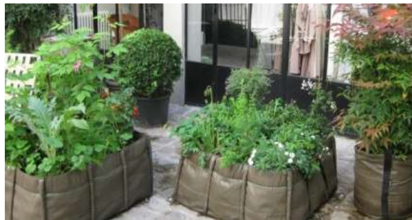
Miljøpunktet opsatte i 2013 planteposerne bacsac.