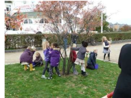
Børn fra børnehaver i indre by planter blomsterløg v. Lad Søerne Blomstre.