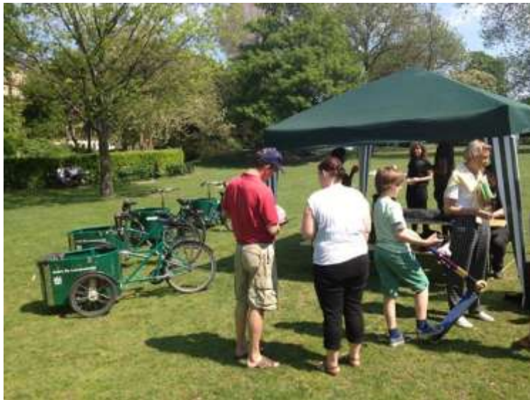
Miljøpunktet foretog partikelmåling i forbindelse med Park Life eventen den 18. maj 2013. I 2014 skal målingerne centreres omkring Nørreport og Torvegade.

I 2025 forventes der at være 100.000 flere Københavnerne og hermed også en større andel af Københavnerne som transporterer sig til og fra hjem/arbejde til og fra indre by og Christianshavn. I dag sker en for stor del af denne transport i bil, ligesom en stor del af erhvervstransporten sker i forurenende lastbiler. Det er en udvikling, som der skal gøres noget ved. Miljøpunktet vil fortsat fokusere på alternative til privatbilismen og erhvervskørslen i lastbil og sætte fokus på den forurening Københavnerne dagligt udsættes for pga. sundhedsskadelige partikler fra transporten. De indsamlede data kan efterfølgende bruges af LU i en dialog med kommunen om luftforurening. I 2014 vil Miljøpunktet have fokus på testkørsel for erhvervsdrivende og familier.