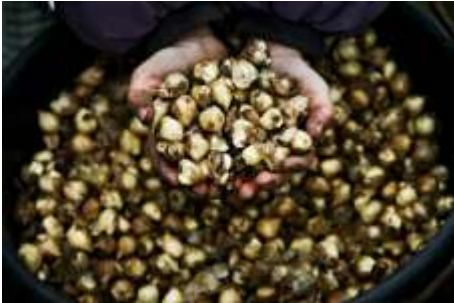
Blomsterløg klar til at blive plantet.