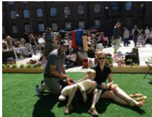
En ny tradition er startet; loppemarked på Rådhuspladsen 2013. I 2014 afholder Miljøpunktet loppemarked igen.