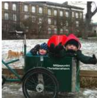
Miljøpunktets publikation om borgere der bruger ladcykel selvom de har bil.