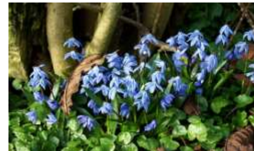
Forår 2014 springer blomsterne ud Til efteråret plantes nye blomsterløg.