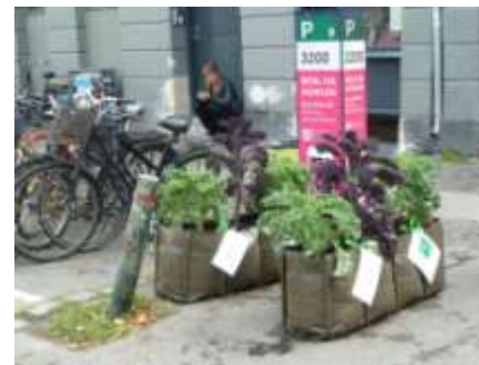
Et lille åndehul er opstået.