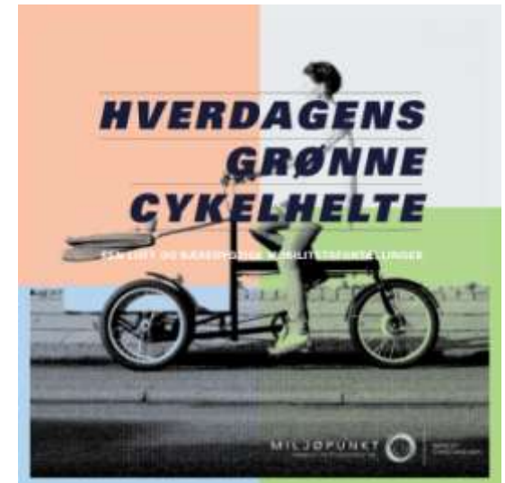
Miljøpunktets publikation om ladcykler indeholder flere historier om familier, der bruger ladcykel selvom de har bil.

I 2025 forventes der at være 100.000 flere Københavnerne og hermed også en større andel af Københavnerne som transporterer sig til og fra hjem/arbejde til og fra indre by og Christianshavn. I dag sker en for stor del af denne transport i bil, ligesom en stor del af erhvervstransporten sker i forurenende lastbiler. Det er en udvikling, som der skal gøres noget ved. Miljøpunktet vil fortsat fokusere på alternative til privatbilismen og erhvervskørslen i lastbil og sætte fokus på den forurening Københavnerne dagligt udsættes for pga. sundhedsskadelige partikler fra transporten. De indsamlede data kan efterfølgende bruges af LU i en dialog med kommunen om luftforurening. I 2014 vil Miljøpunktet have fokus på testkørsel for erhvervsdrivende og familier.