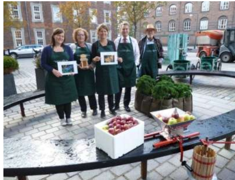
Miljøpunktet gør klar til Kulturnatten (oktober 2013).

Der holdes løbende koordineringsmøder mellem Lokaludvalg, Københavns kommune og Miljøpunkterne. Projekterne er hovedsagligt beregnet på at blive udført af frivillig arbejdskraft, suppleret med faglig kompetence under igangsætning, tilretning efter et evt. pilotprojekt og studenterhjælp, samt faglig hjælp til den kommunikative skriveproces til sidst. Miljøpunktets projekter skal være lokalt forankrede og netværksskabende. Miljøpunktets opgave er at stå til rådighed med faglig kompetence til gennemførelse af aktiviteter og projekter. Der søges eksterne midler og nedenfor fremgår det hvilke aktiviteter, som afvikles med medfinansiering fra eksterne aktører.