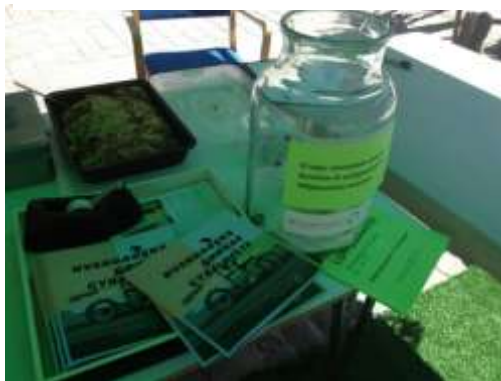
Overskuddet fra loppemarkedet går til Miljøpunktets ladcykelordning.