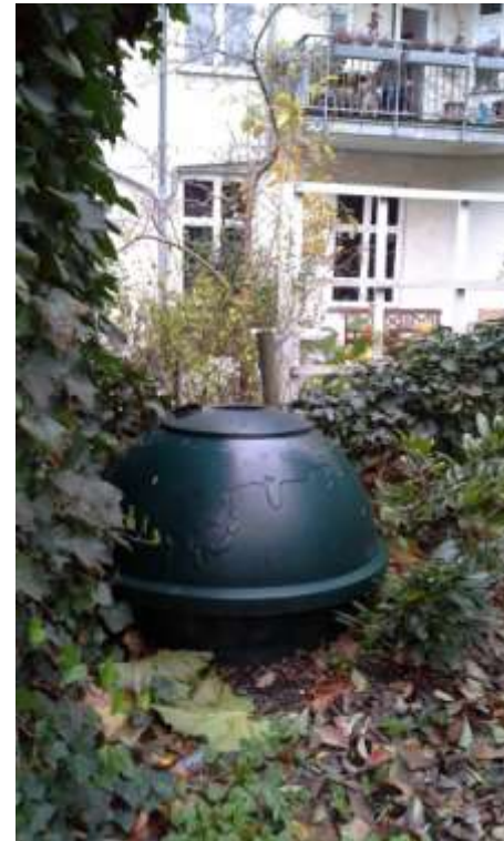
Miljøpunktets kompostbeholder på Christianshavn.