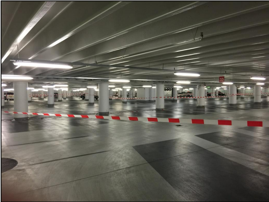
Nederste dæk i p-anlægget på Israels Plads står pt. stort set tomt