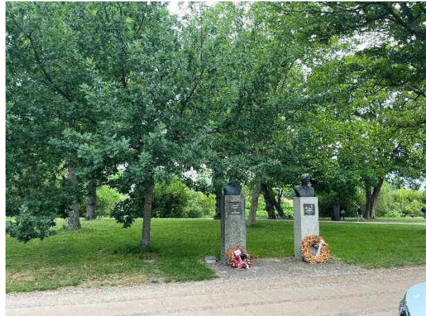
Fotos af nuværende gruspladser langs Amaliegade med busten af tre krigshelte: Anders Lassen, Kai Birksted og Thomas Dinesen