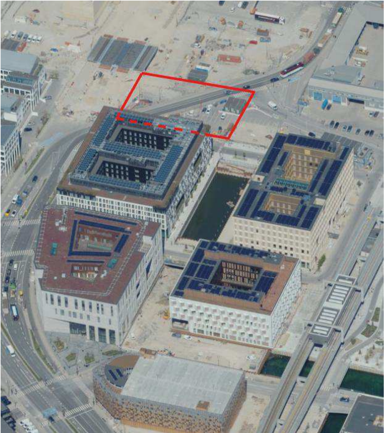
Skråfoto af lokalplanområdet fra 2023 med de fire udførte byggefelter. Med uret fra det nederste venstre hjørne ses Østre Landsret, Comwell, EIFO og Accura. Det aktuelle byggefelt er placeret ved siden af Comwell mod nord (placering af byggefeltet er angivet med rød markering).