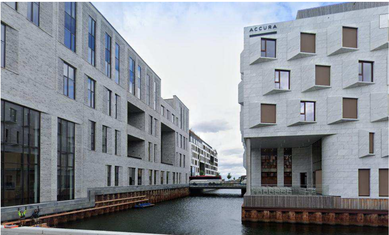
Området set mod nord fra Orientkaj med Accura og Østre Landsret forrest i billedet og Comwell i baggrunden.