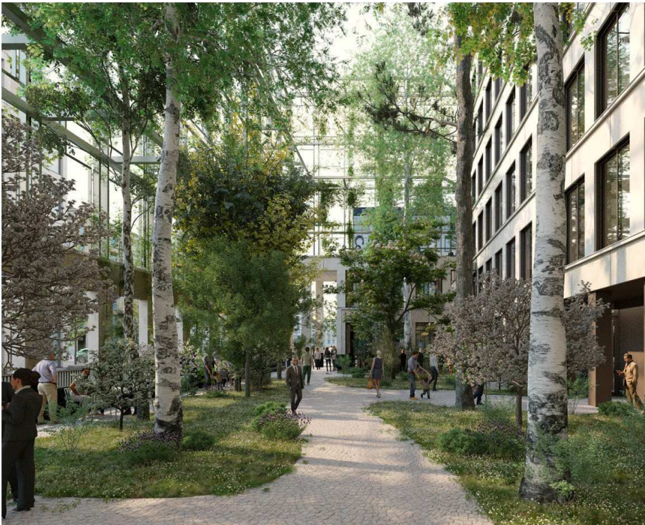
Visualisering af projekt med espalier set fra "byhave"