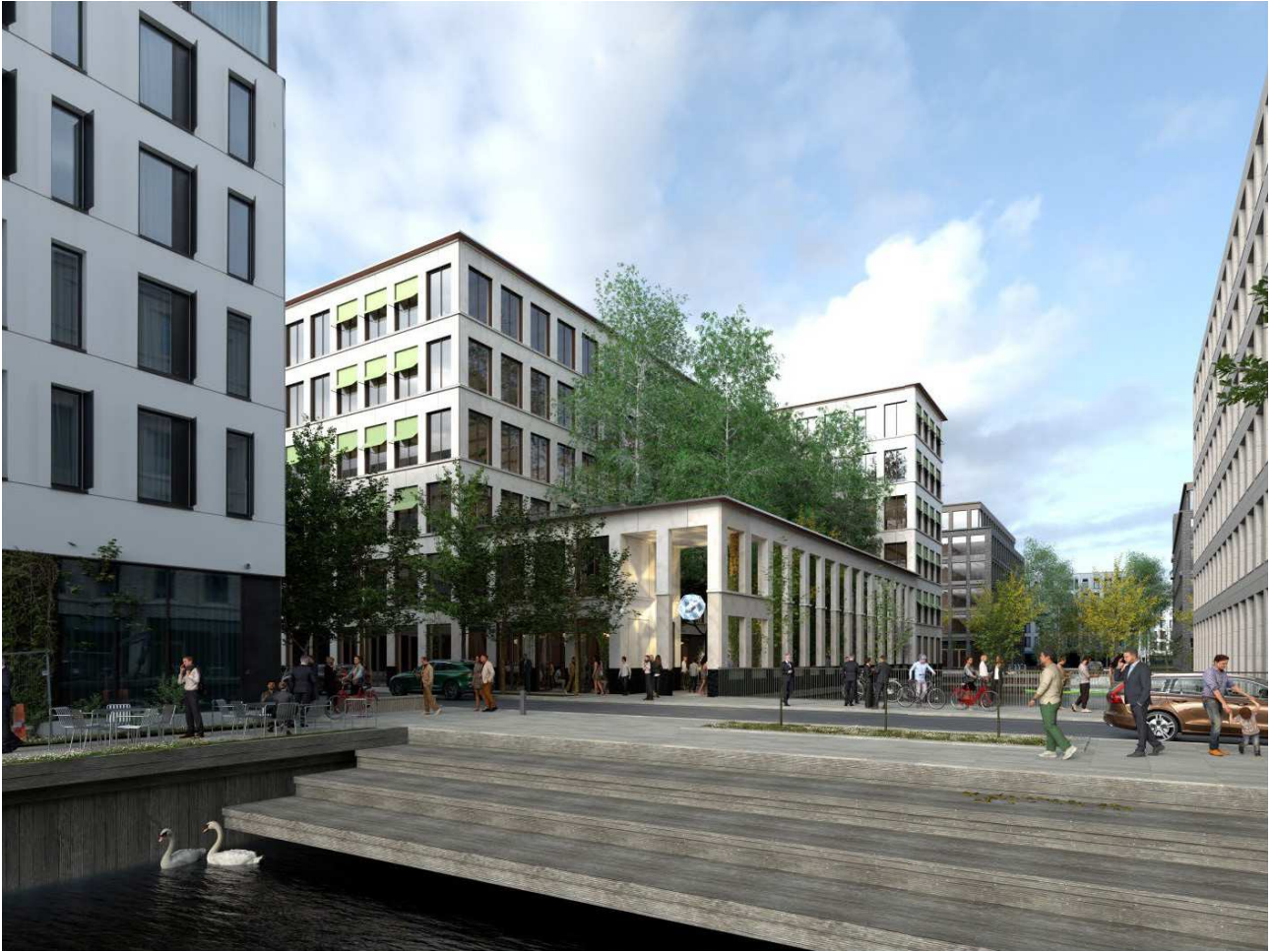
Visualisering af projekt med havemur i 2 etager set fra Istanbulgade