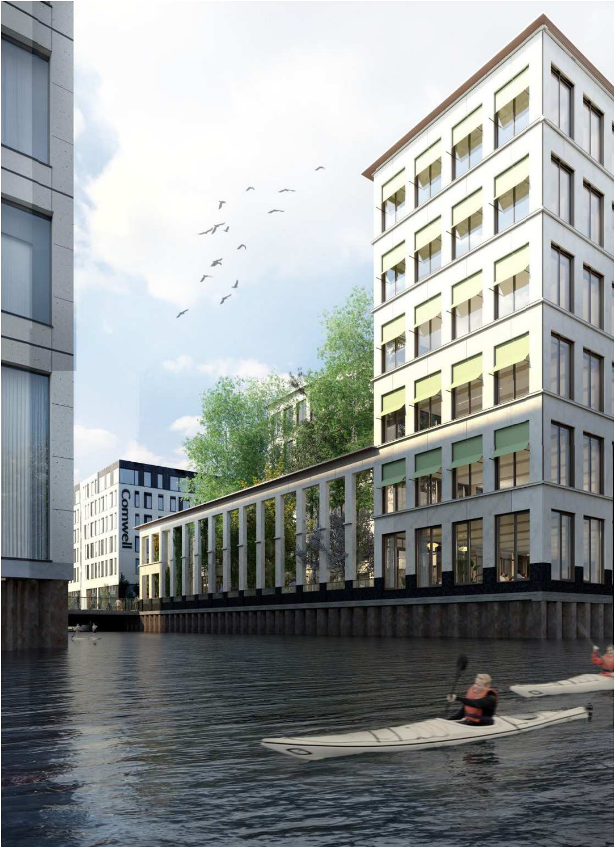
Visualisering (beskåret) af projekt med havemur i 2 etager set fra kanal