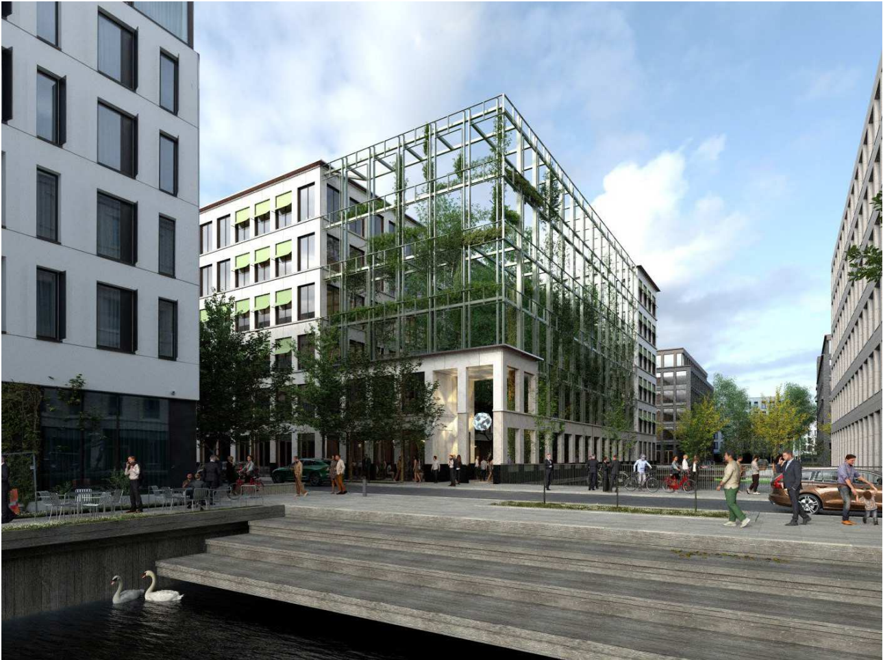
Visualisering af projekt med espalier set fra Istanbulgade (vist med facadebegrønning)