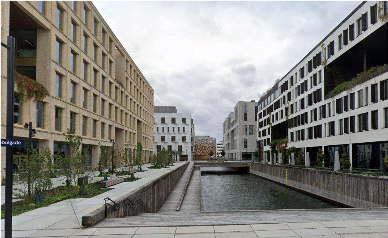
Kanalpladsens område set mod syd fra Istanbulgade. EIFO og Comwell ses forrest i billedet, herefter Accura og Østre Landsret. Længst væk ses parkeringshuset ud til Orientkaj, som ligger i et andet underområde i lokalplanen. De opførte bygninger ses som sluttede volumener med ensartet højde inden for det enkelte byggefelt og med begrænsede tilbagetrækninger.