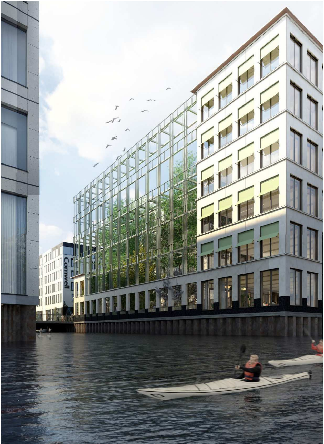
Visualisering (beskåret) af projekt med espalier set fra kanal (vist uden facadebegrønning, men med træer i byhaven)