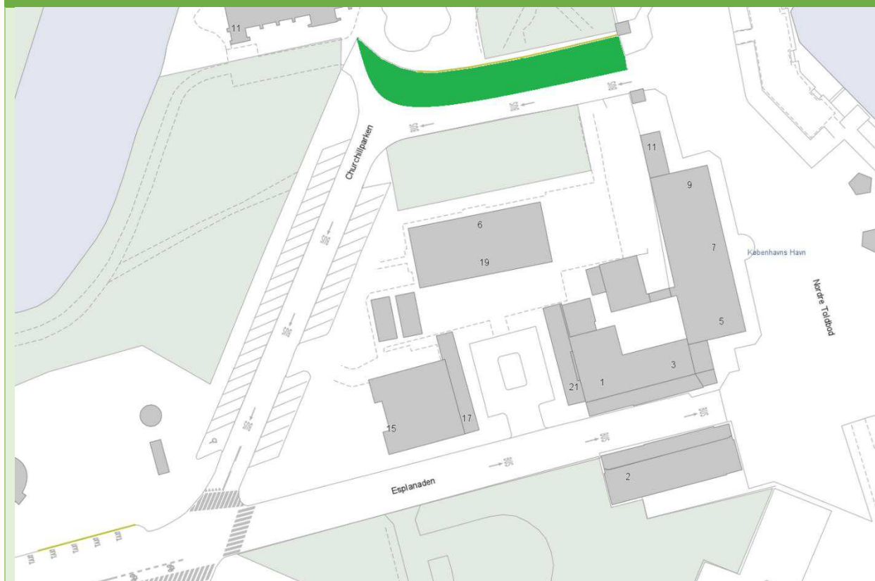
Figur 1: Visualisering af løsningsforslag: Fredeliggørelse med driftssikkert flow

Simpel skitse af vores løsningsforslag, hvor turistbussers kørsel ensrettes, og der frigøres et større grønt areal foran Gefionspringvandet. Samtidig bevares adgang til matriklerne omkring Churchillparken og den engelske kirke. I løsningen kan busser ikke længere køre ned ad Churchillparken fra Esplanaden, men kan fortsat betjene området via sløjfen i Churchillparken gennem porten ved Nordre Toldbod, hvor vejen er indsnævret. Vi foreslår desuden et tydeligt totalforbud mod standsning, parkering og ophold ved Churchillparken, og at Hop On Hop Off-busser omlægges til stop ved Frihedsmuseet, hvor der samtidig etableres nye taxiparkeringspladser.