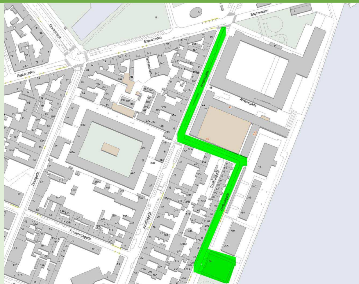
Figur 2: Visualisering af alternativ løsning ved lukning af porten/Churchillparken

Simpel visualisering af en alternativ løsning, hvis der etableres forbud mod buskørsel gennem Churchillparken. Der etableres en driftssikker erstatningsløjfe via Amaliegade og Toldbodgade (markeret med grønt), hvor turistbusser gives adgang til at køre i begge retninger frem til Amaliehaven. Her indrettes en vendemulighed, så busser kan vende kontrolleret og foretage et kort ophold efter klare rammer, før de kører ud af området igen. Løsningen vil ikke løse de problemer, som busser der er nødsaget til at køre til Nordre Toldbod vil støde på, men det vil minimere antallet af busser ved Nordre Toldbod/Churchillparken markant.