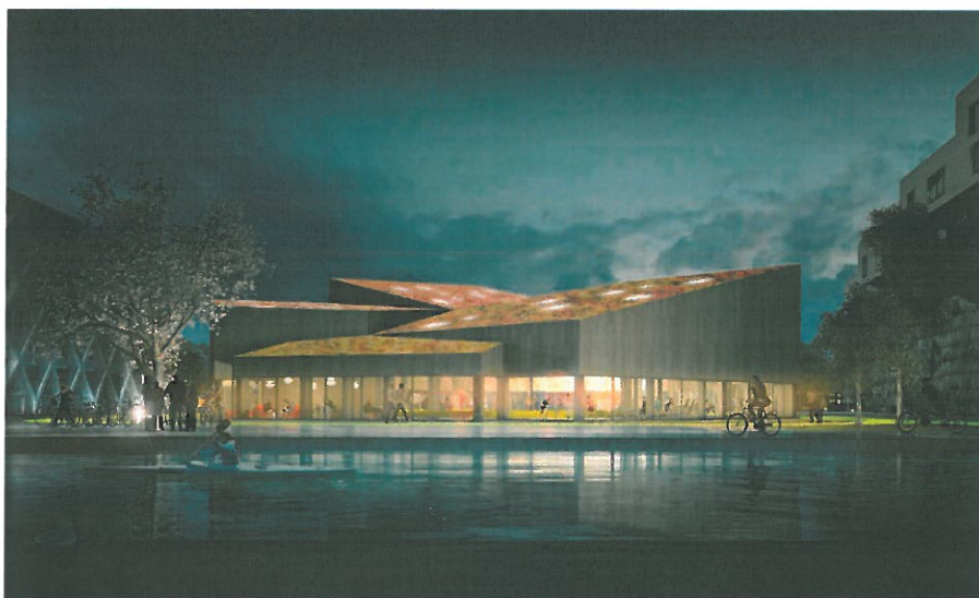
Illustration Nord Architects

Placeringen på grunden og bygningens udformning gør, at der ikke skabes en egentlig bagside. Hallen får et transparent glasbånd, som løber hele vejen rundt om bygningen og skaber åbenhed mod parken. Ydermere skiller den sig ud i forhold til omgivelserne, idet alle facaderne udføres i træ, bortset fra en klatrevæg i beton. Tagfladerne belægges med enten sedum, lignende stenurter eller græsarter.