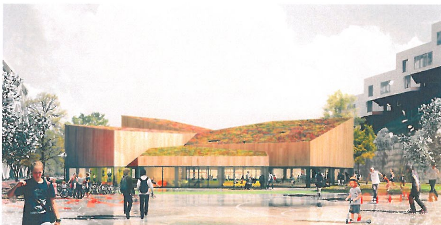
Lethallen set fra Ørestads Boulevard. Illustration Nord Architects

ningen og skaber dynamik både indvendigt og udvendigt. De forskellige vinkler binder bygningens flader sammen til ét samlet volumen.